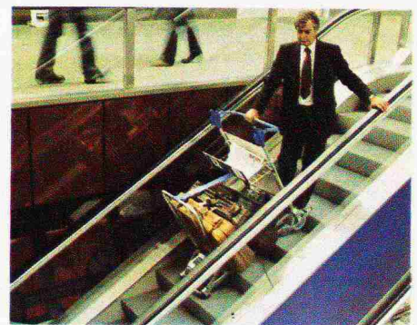
Bild 1. Rolltreppengängiger Gepäckrolli

Für die Aufbewahrung des Gepäcks sind in der Bahnhofshalle 200 Selbstbedienungs-Schliessfächer vorhanden. Die sperrigen Stücke lassen sich auf