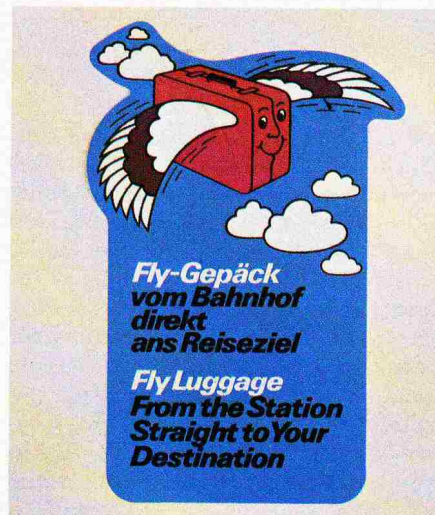
Bild 2. Fly-Werbeposter. Zufrieden schmunzelnd wirbt der fliegende Koffer für die weltweite Gepäckabfertigung Bahn-Flugzeug

Stadt, die Fahrt zum Flughafen, der Abschied und endlich der Check-in – das alles ist ohne Gepäck bedeutend angenehmer. Auch der schweizerische Ferienreisende schätzt es, wenn er am Vorabend des Reisetages sein Gepäck aufgeben kann. Damit sind die Reisevorbereitungen abgeschlossen, und ohne Gepäck wird der Reisetag bereits zum ersten Ferientag. Gegen 5000 Fly-Gepäcksendungen in den letzten drei Monaten und das lebhaftere Interesse ausländischer Bahn- und Fluggesellschaften am Fly-Projekt deuten denn auch darauf hin, dass mit dem Fly-Ge-