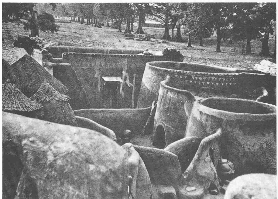
Ein Gehöft in Kassena (Obervolta). Im Hintergrund das rechteckige Haus des Mannes, im Vordergrund runde Häuser der Frauen. Links: strohgedeckte Speicher

Bei den bisher erwähnten Arbeitsansätzen handelte es sich um die Bestandsaufnahme, um historische Gesichtspunkte und um die Strukturen der noch «traditionellen» Gesellschaft. Doch wird auch der aktuelle Bezug nicht aus den Augen gelassen. Ungeachtet aller Schlagworte wie «négritude» und «authenticité», ist sich die afrikanische Öffentlichkeit sehr oft nicht im klaren, was damit konkret gemeint sein sollte. Das grosse Vermächtnis der afrikanischen Kultur – so-