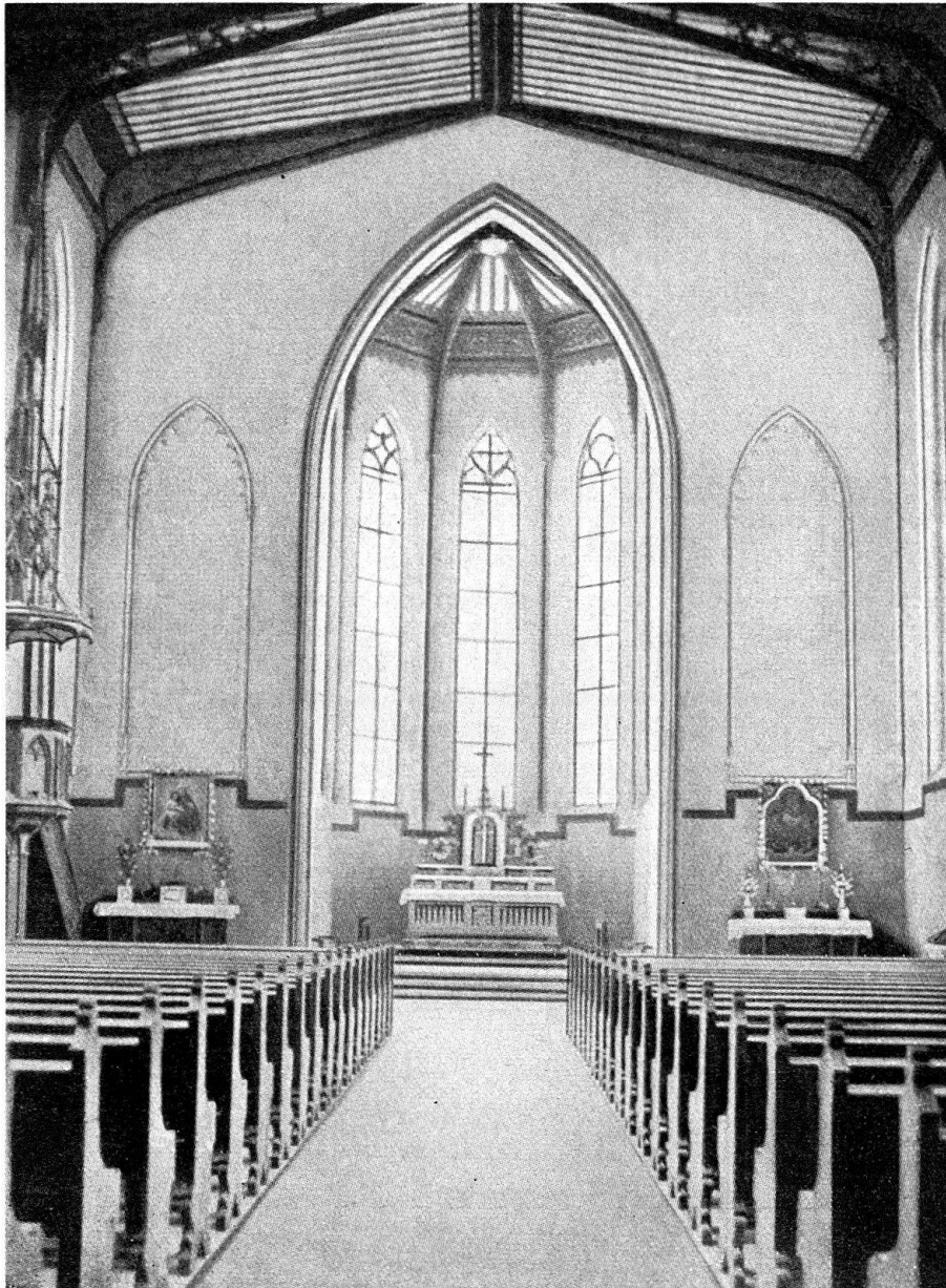
Abb. 3. Winterthur. Katholische Kirche. Innenraum im ursprünglichen Zustand (Photo um 1880)

sters, die oberen Räume des Waaghauses für diesen Zweck einrichten zu lassen. Im Erdgeschoß war ein Feuerwehrmagazin, darüber ein Raum für das Kadettenmaterial vorzusehen. «Damit war wieder eine wertvolle, der Bürgerschaft gehörende Gebäulichkeit gleichsam verschenkt und eine kostspielige Baute, deren Ausführung über 35 000 Franken in Anspruch nahm, beschlossen», klagte ein früherer Magistrat über diesen Beschluß. Im Herbst 1866 wurde die von Bareiß umgebaute Kunsthalle eröffnet. Holztore mit Glasoberlichtern schlossen die vier Bögen der Erdgeschoßhalle. Die drei östlichen dienten der Feuerwehr, das westlichste führte in das neue, elegante Treppenhaus mit dem zierlichen Gußgeländer und dem kunstvollen Gitter, welches die nach oben führende Treppe abschließt. Im mächtigen Dachstuhl baute Bareiß ein Oberlicht ein, das dem hohen Aus-