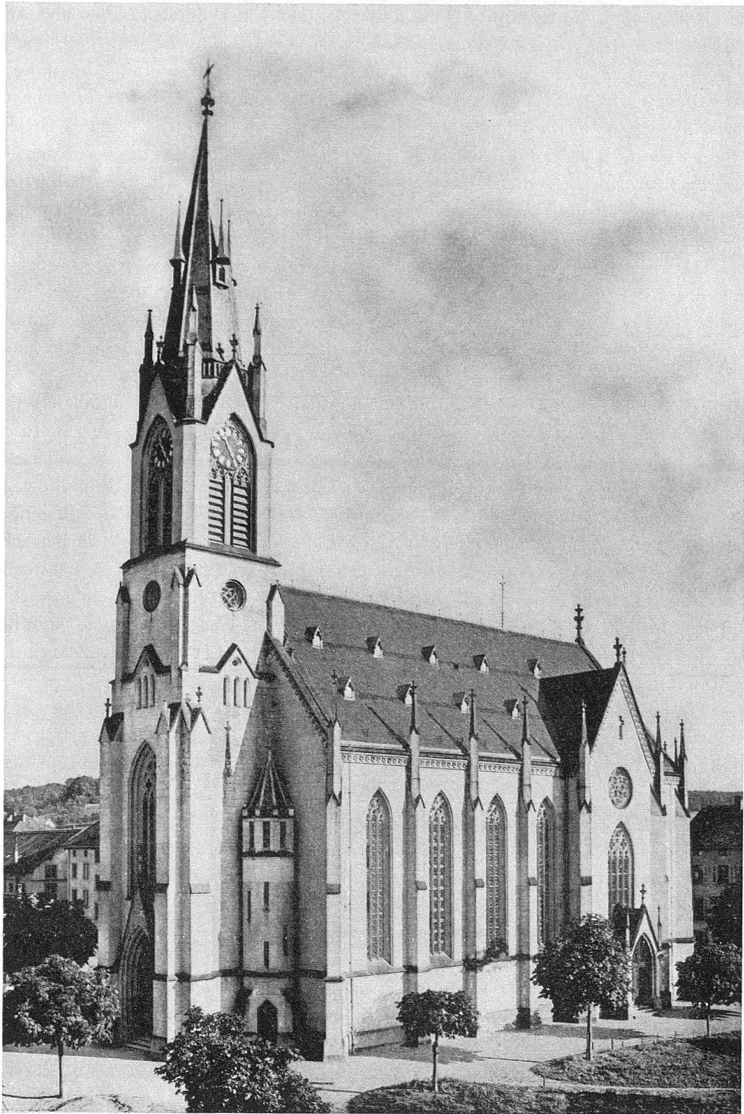
Abb. 2. Winterthur. Katholische Kirche St. Peter und Paul, von W. Bareiß 1864–1868 errichtet (Photo um 1890)