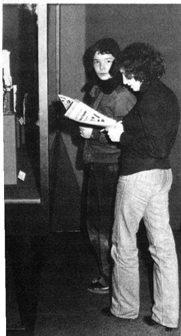
2 Concours d'élèves dans l'exposition des «Trésors du Musée de Bagdad», Musée d'art et d'histoire, Genève, 1978.

ment qui s'inscrit parfois dans le mobilier urbain. On a réfléchi sur les accès; les entrées des musées souvent placés dans des maisons historiques cherchent à être un appel et luttent aujourd'hui contre la peur psychologique des seuils par le jeu des transparences où se devinent les intérieurs.