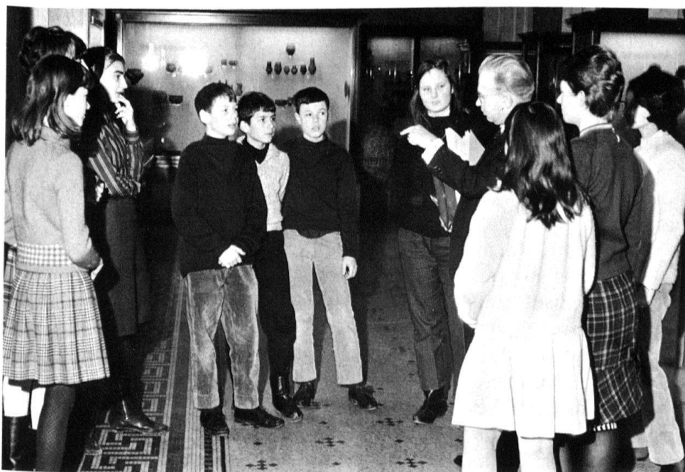
1 Séance du jeudi matin au Musée d'art et d'histoire, Genève, 1967.

Cette volonté s'exprime déjà dans la manière de faire venir les gens au musée. Il y a d'abord les voies traditionnelles de la publicité où les annonces, les affiches, les bulletins d'information et l'utilisation des media doivent contribuer à donner une certaine image du musée à visiter. Cela continue par la signalisation extérieure du bâti-