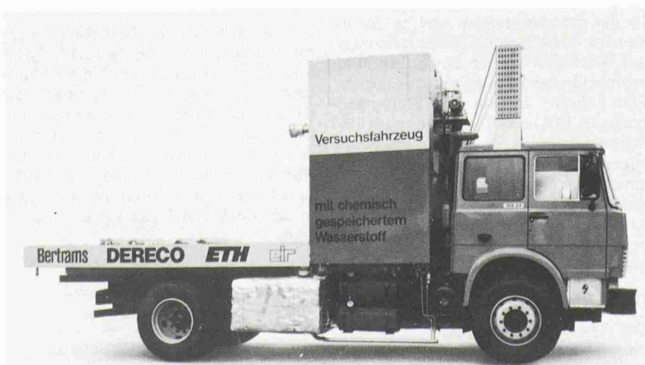
Bild 1. Wasserstoff-Versuchsfahrzeug der 2. Generation