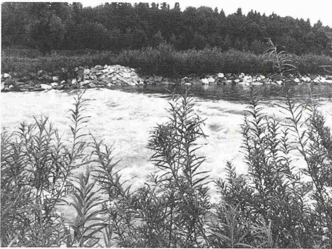
Eine Naturstein-Sohlenrampe in der Thur bei Pfyn/Hüttlingen sichert einen kleinen Absturz mit einem Höhenunterschied von 80 cm