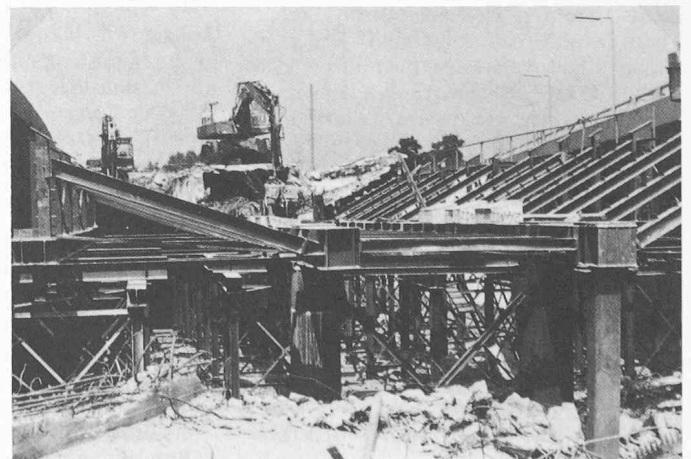
Bild 3. Abbruch der Nordbrücke mit einem japanischen 120-t-Betonbeisser Kami Kami auf Stahlgerüst, das auch als Lehrgerüst für die neue Brücke dient