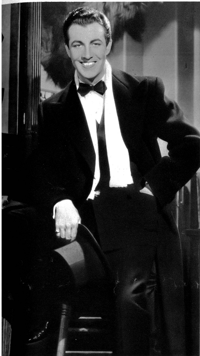
Robert Taylor . . . der neueste Weltstar! Ueber Nacht berühmt geworden, ist er heute der Liebling aller Frauen und wird in der kommenden Saison in verschiedenen Metro-Goldwyn-Mayer Filmen auftreten.

sagte, hat sich inzwischen erfüllt; und zumal für eine in früherer Zeit als hoffnungslos geltende Erkrankung des Zentralnervensystems: das Lähmungsirresein oder die Paralyse, fälschlich auch „Gehirnerweichung“ genannt, hat die moderne Medizin auf diese Weise ein wirksames neues Behandlungsverfahren geschaffen. Schon im Laufe des vorigen Jahrhunderts war es aufgefallen, daß gewisse Formen von Geistesverwirrung und Irresein eine bedeutende Besserung erfuhren, wenn etwa die Kranken irgend einen Zufall von einer mit hohem Fieber einhergehenden Ansteckungskrankheit befallen wurden. Bereits 1848 erschien ein derartiger Bericht in Bonn und 1864 ein ähnlicher in Rostock; aber erst der neueren Zeit blieb es vorbehalten, aus diesen Zufallserfahrungen planmäßig ein klinisch brauchbares Behandlungsverfahren der furchtbaren Paralyse abzuleiten. Der Wiener Psychiater Julius Wagner-Jauregg war es, der zum ersten Male den Schritt von der Theorie zur Praxis wagte und Kranke, die an der Paralyse litten, bewußt mit fiebererzeugenden Mitteln behandelte.