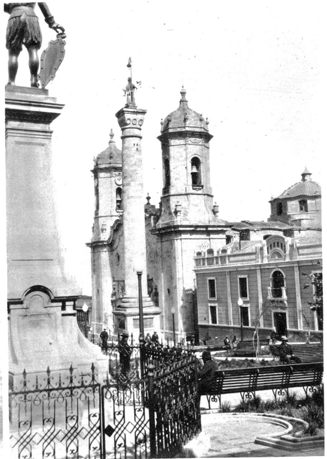
Die Plaza rode Novembre mit dem Denkmal Alfonso de Ihanéz, der Freiheitsstatue und der Kathedrale in Potosi

Der Markt in Potosi ist die Straße. Selten findet man die gleiche Fremdartigkeit, die gleiche Farbenfreudigkeit und soviel anmutige Marktfräuen. Die Cholas, Indianermischlinge, mit hellgelben Strohhüten und bunten Seidentüchern, die Indianerinnen mit ihren purpurroten Leberwürfen zu orangenen Röcken, die Indios mit ihren buntgemusterten Ponchos, geben dem Straßensbild eine ungemein reizvolle Note. Tomaten, Aji, herrliche tropische Früchte aus den Jungstälern, und an zweihundert verschiedene Kartoffelsorten — Bolivien ist das Geburtsland der Kartoffel — Schaffäße, selbstgefertigtes Tongeschirr und Schilfflöten werden feilgeboten. Zwischen die leuchtenden Far-