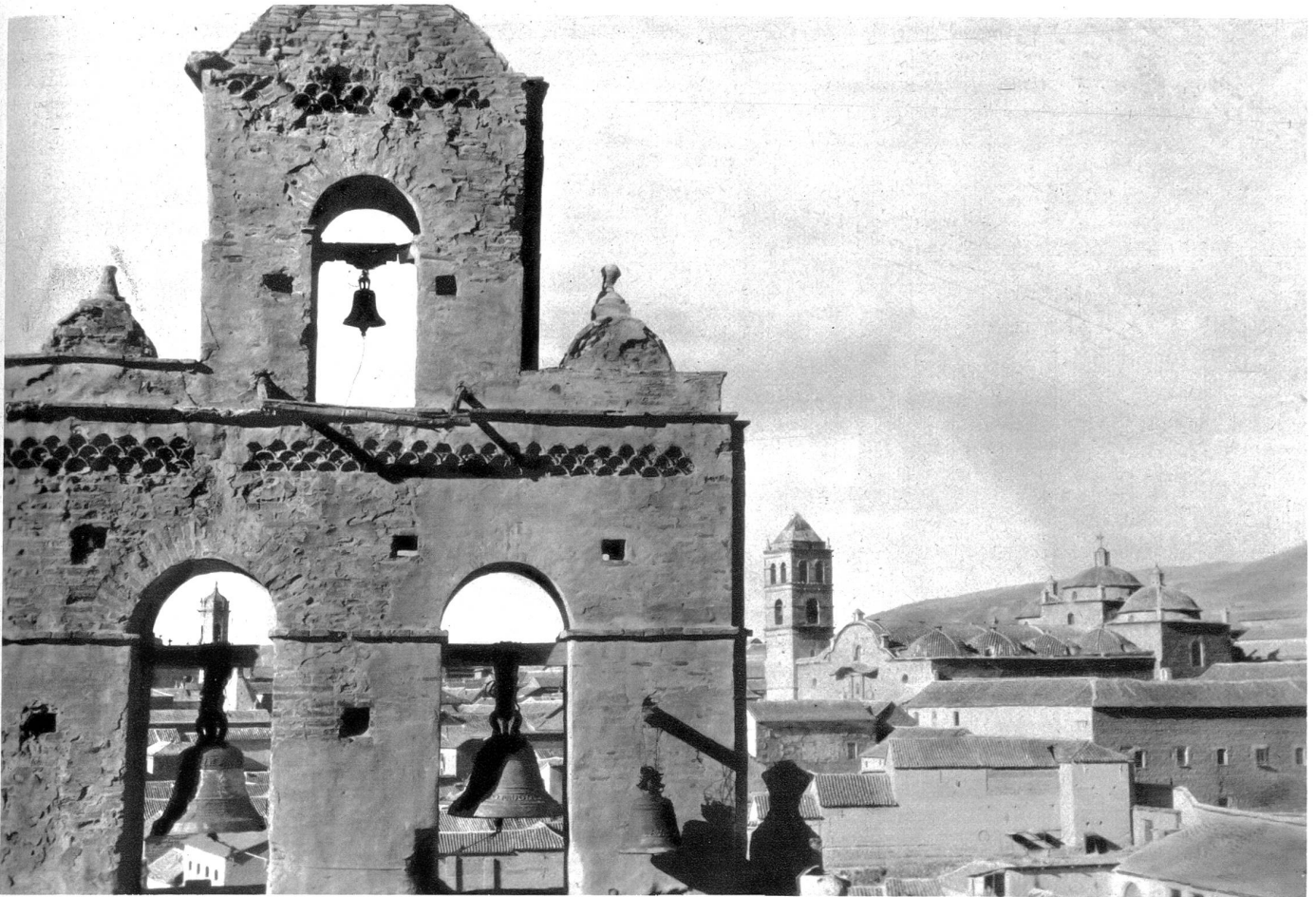
Die San Franziskuskirche in Potosi mit dem berühmten Glockenturm, von den Spaniern erbaut