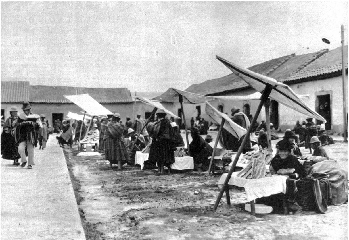
Bolivianische Bäuerinnen auf dem Markt in Potosi, die Kinder tragen sie auf dem Rücken bei sich