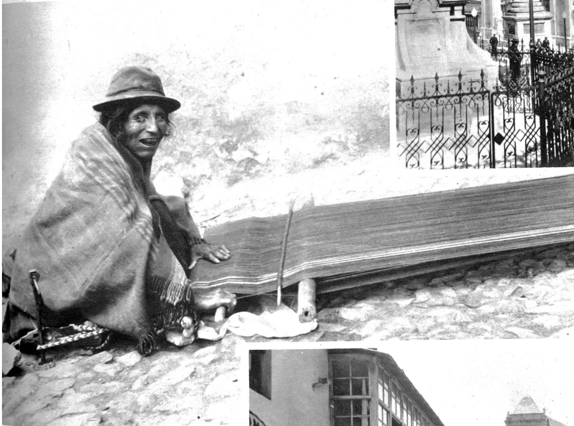
Alte Indiofrou in Potosi beim Anfertigen eines Wollponchos, dem Universalbekleidungsstück der Hochlandindios

ben des bunten Straßensbildes schieben sich die Lamas mit ihren dummen, hochmütigen Mienen.