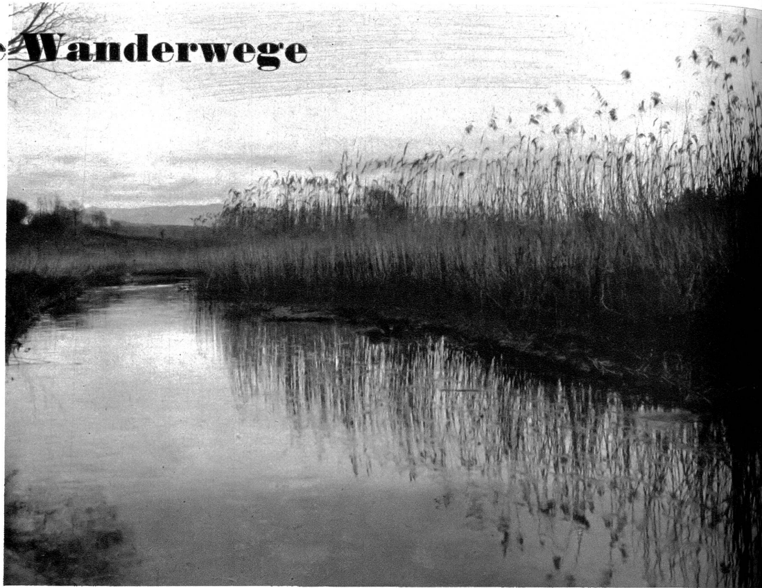
In der Kleinhöchstetten-Au

Dem Automobilisten die Straße, Dem Wanderer die stillen Wege.