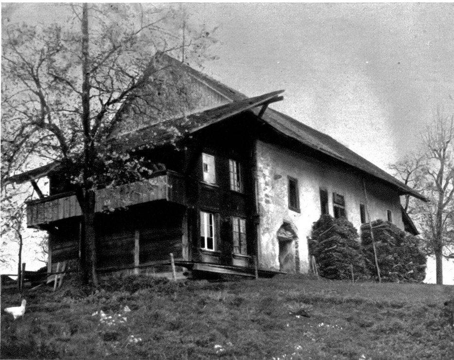
Die alte Kirche zu Kleinhöchstetten

Die eine Haupttroute, vom Thunplatz ausgehend, erreicht durchs Dählhölzli über Elfenau, Mettlenhölzli die Ortschaft Muri. Von hier folgt sie teilweise dem alten Aaretalweg, immer am Rande der Aareterrasse bleibend, und erreicht über Krägigen, Border- und Hinter-Märchligen, Raintalwald, Kleinhöchstetten, Hunziken die Ortschaft Münsingen. Von hier zieht sie sich östlich der Autostraße durch den Uttenlohwald, Wichtach nach Kiesen und erreicht über