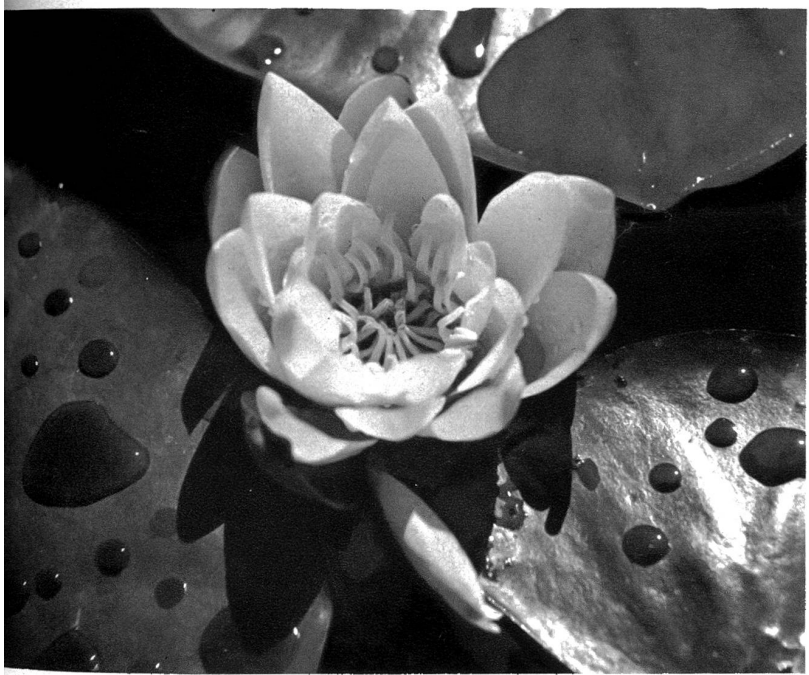
Seerosen in der Kleinhöchstetten-Au

Thungschneit und Bäumberg Thun. Die andere Hauptroute ist der vielbegangene Aaredammweg. Vorab soll die erste Hauptroute mit den kürzern Abzweigungen zu den Ortschaften, nebst den Zugängen zum Aaredammweg und zu den Fähren markiert werden.