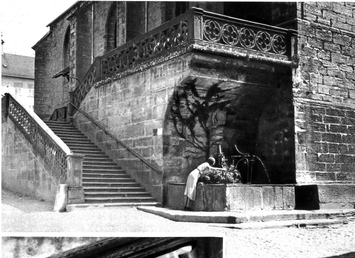
Treppe und Brunnen bei der Kirche St. Laurant