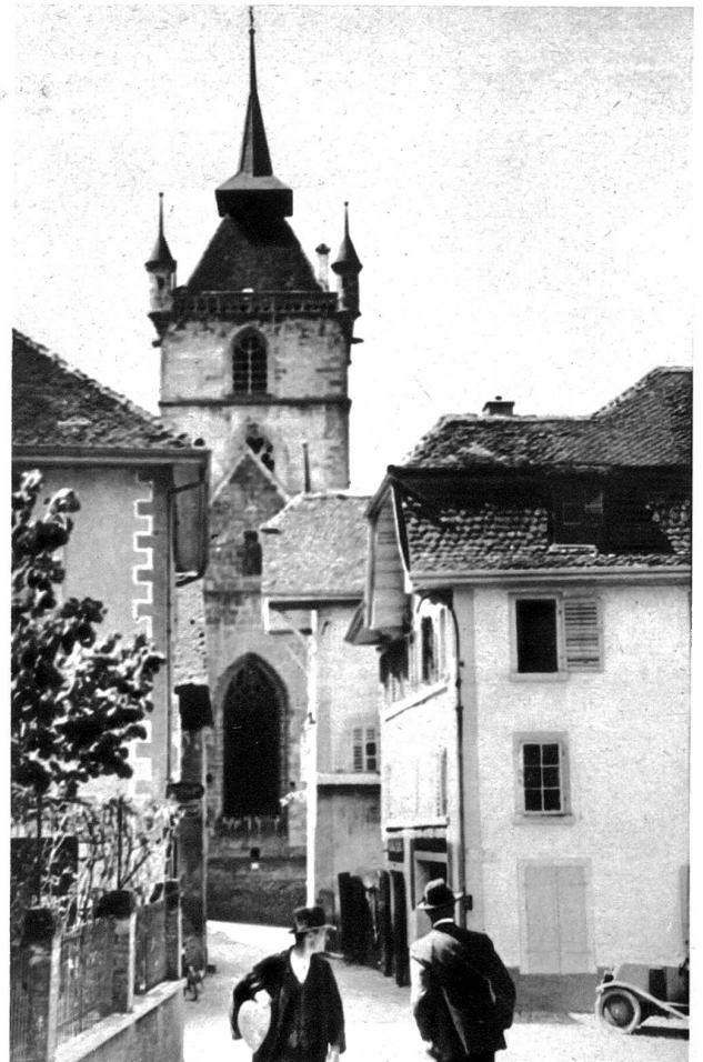
An der Kirchgasse

noch erzählen von Kämpfen und Streitigkeiten, aber die heutige Wirklichkeit ist so schön, daß man das historische Moment mehr als „Beigabe zum Verständnis“ betrachten muß.