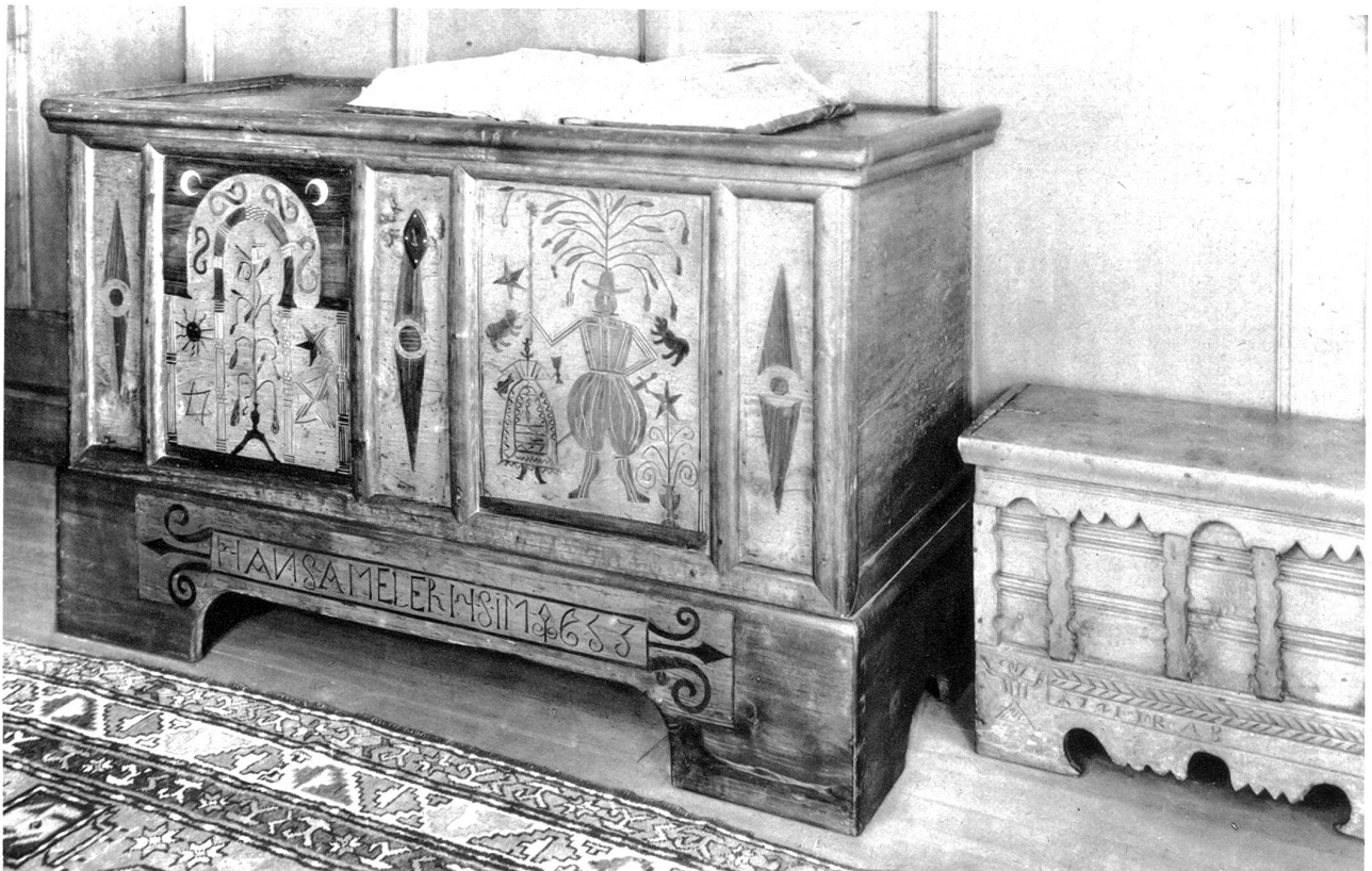
Zwei schöne alte Truhen aus dem 17. und 18. Jahrhundert

in der Intarsia-Arbeit. So finden wir vielerorts sehr schmuckvoll ausgeführte Stücke, wobei die farbigen Hölzer alle in die ausgeschnitzte Form eingeleimt wurden, während bei andern Arbeiten die Ornamente aus zwei dünnen Platten ausgefägt wurden, um dann auf das Grundholz aufgeleimt zu