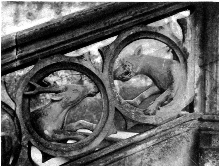
Figürliche Ornamente bei der Kirche