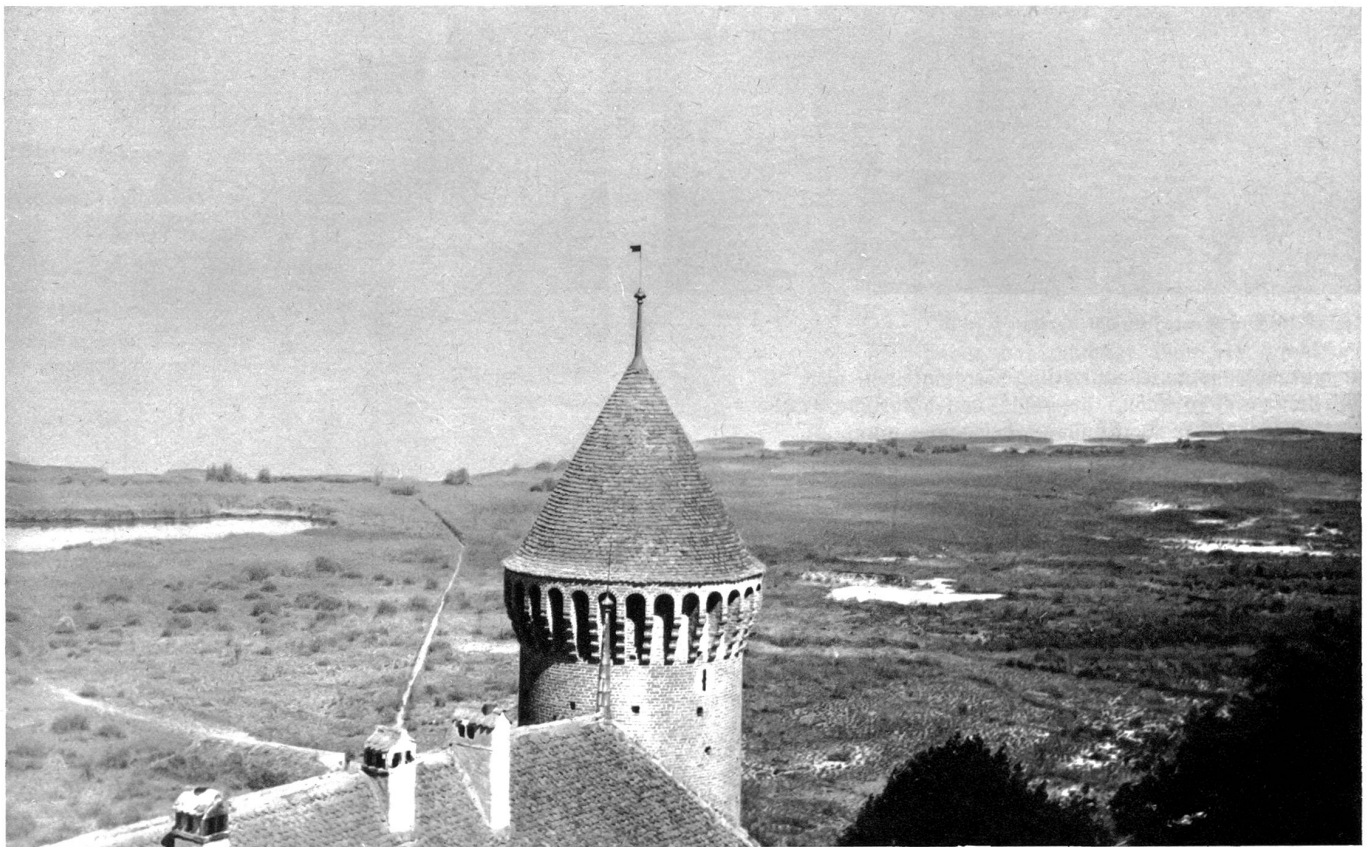
Estavayer. Ausblick vom Donjon zum Neuenburgersee