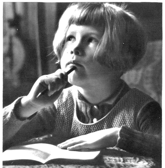
Des Dichters Enkelin