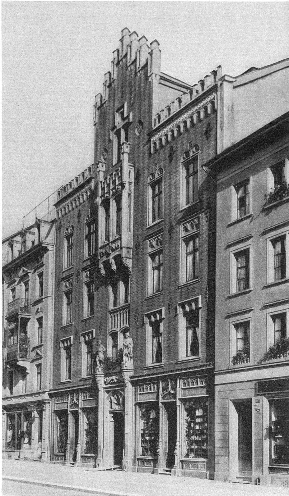
Abb. 5. Winterthur. Geschäftshaus «Gloria» von W. Bareiß, 1866–1867 (Photo um 1890)