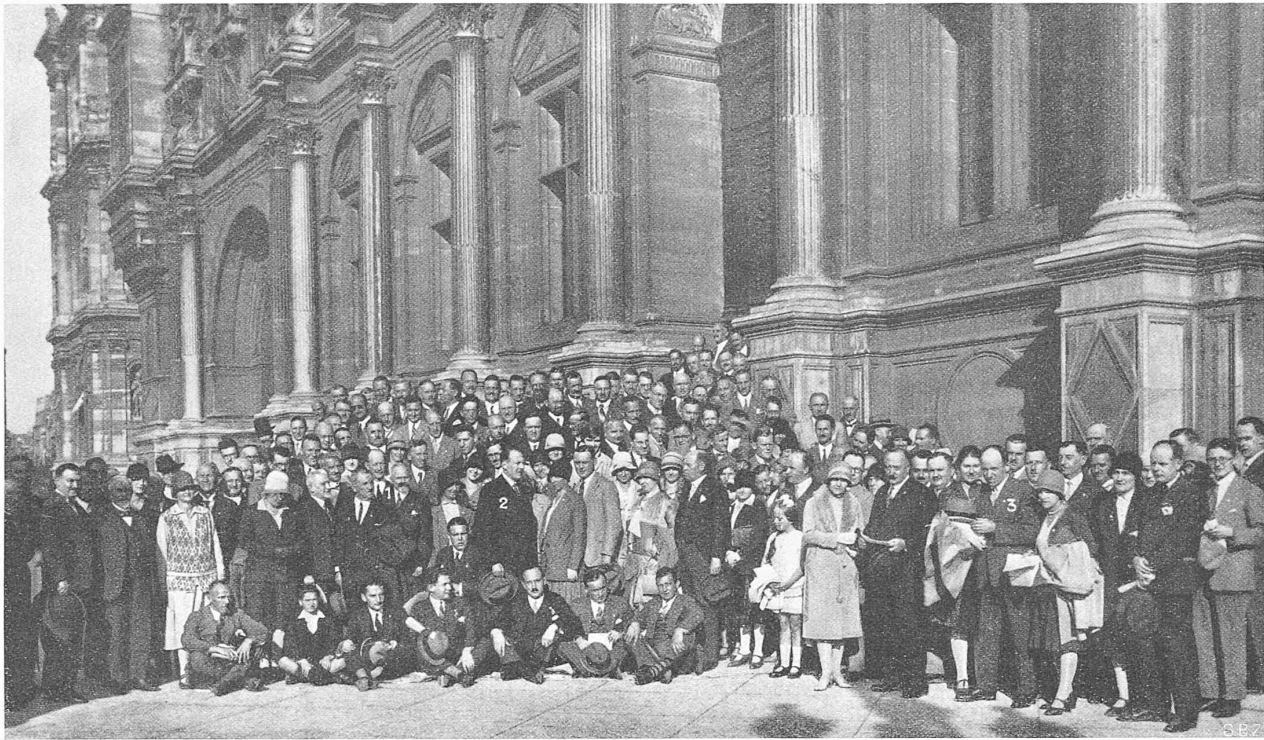
Gruppenbild von Teilnehmern an der Generalversammlung der G. E. P. vor dem Hotel de Ville in Paris, am 28. September 1929.