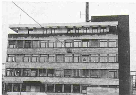
Bild 1. Gebäude-Ansicht. Die Stahlbetonstützen zwischen den Fensteröffnungen müssen auch den Stockwerk-Schub aus Windlasten aufnehmen. Diese Stützen bilden zusammen mit den Geschossdecken eine relativ biege-weiche Rahmenkonstruktion

Adresse des Verfassers: Dr. E. Kessler, Berater Bauingenieur SIA, 9546 Tuttilwil.