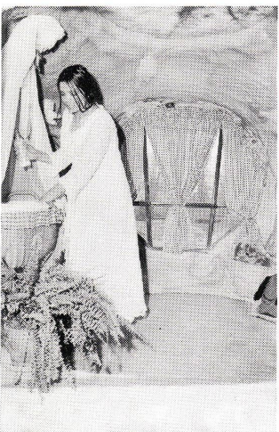
Do it yourself...

...der originellste Weg, Ihre Wohnung zu vergrößern.