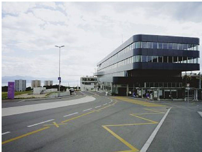
Station Vennes, Blick Richtung Süden.