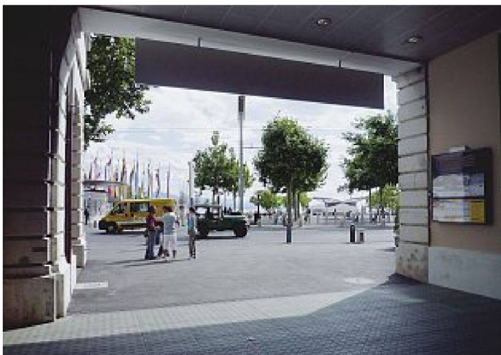
Endstation Ouchy, am Lac Léman.