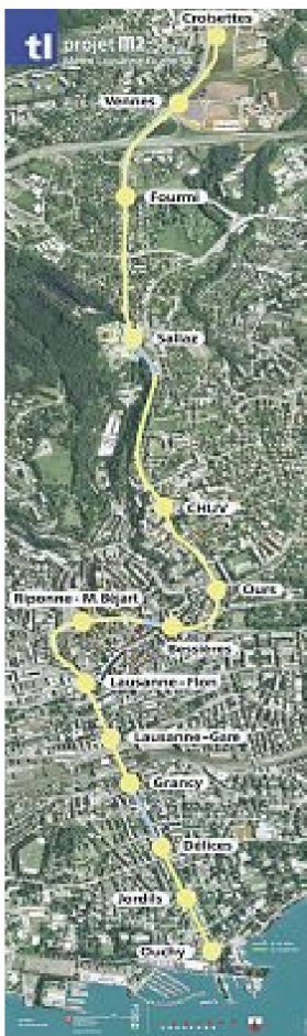
Oben: Streckenplan der neuen Metrolinie m2, rechte Seite: Pont Bessières über der Rue Centrale, Rue Saint-Martin, unterhalb der Kathedrale.

Gian-Marco Jenatsch Die Metrolinie m2 verbindet das Lausanner Seeufer mit Vororten im Norden. Obwohl sie mehrheitlich unterirdisch verläuft, löst sie in den Quartieren entlang der Strecke unterschiedliche urbane Impulse aus. Das Infrastrukturbauwerk wird zum Katalysator der städtebaulichen Entwicklung.