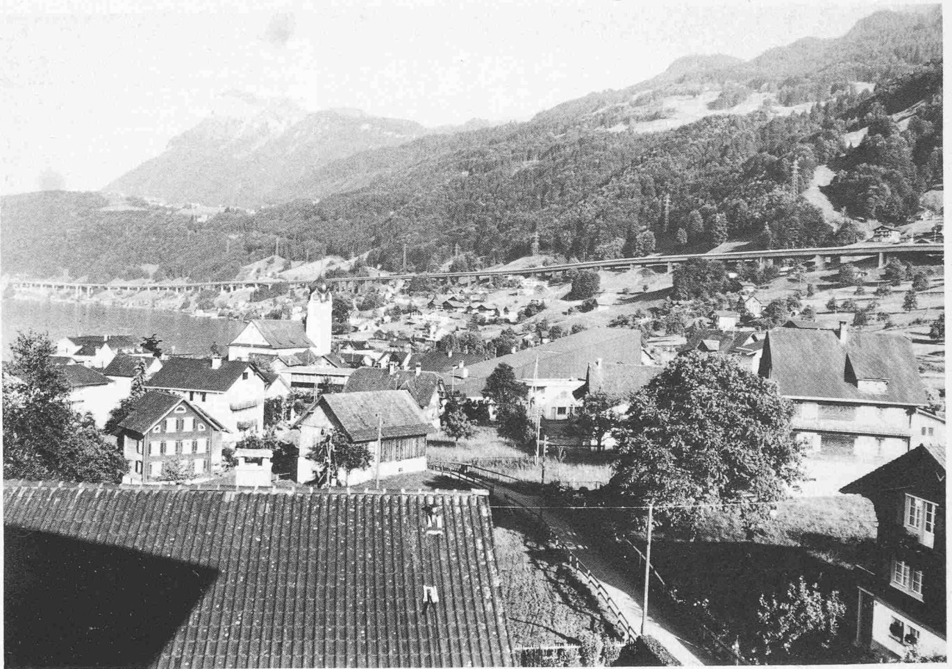
Auf einer Länge von 3148 Metern, gestützt auf 58 Pfeiler, zieht sich der Viadukt wie ein schmales Band über den topographisch und geologisch komplexen Hang zwischen Beckenried und dem Nordportal des Seelisbergtunnels