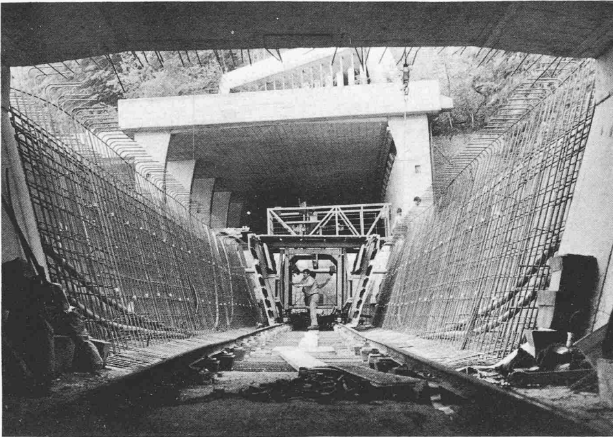
Lehnenviadukt Beckenried. Stand der Bauarbeiten: Mitte Mai 80. Schalung und armieren des letzten Brückenfeldes vor dem Nordportal des Seelisbergtunnels