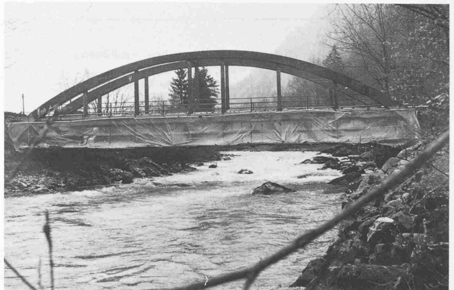
Bild 1. Gizenenbrücke mit untergehängtem Arbeitsgerüst

Spannungsnachweise mussten anhand der heutigen Verhältnisse neu erstellt werden. Die Resultate der Berechnung zeigen, dass sowohl die Bogenträger als auch die Fahrbahnaufhängungen den geforderten Belastungsannahmen der genannten Norm genügen. Die Fahrbahnträger wurden damals, wie aus der vorhandenen Armierung ersichtlich, durch nicht zutreffende Verhaltensannahmen des Systems, starrer Bogen und starre Aufhängungen, als Durchlaufträger berechnet. In Wirklichkeit bewirkt