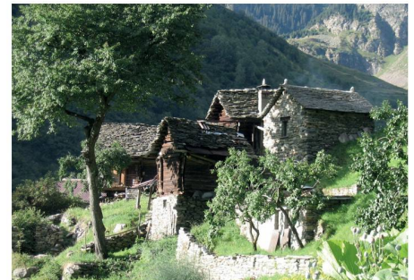
01 Rustici am Dorfrand von Madra im Val Malvaglia. Der Umbau von Rustici im Tessin erhält endlich eine gesetzliche Basis