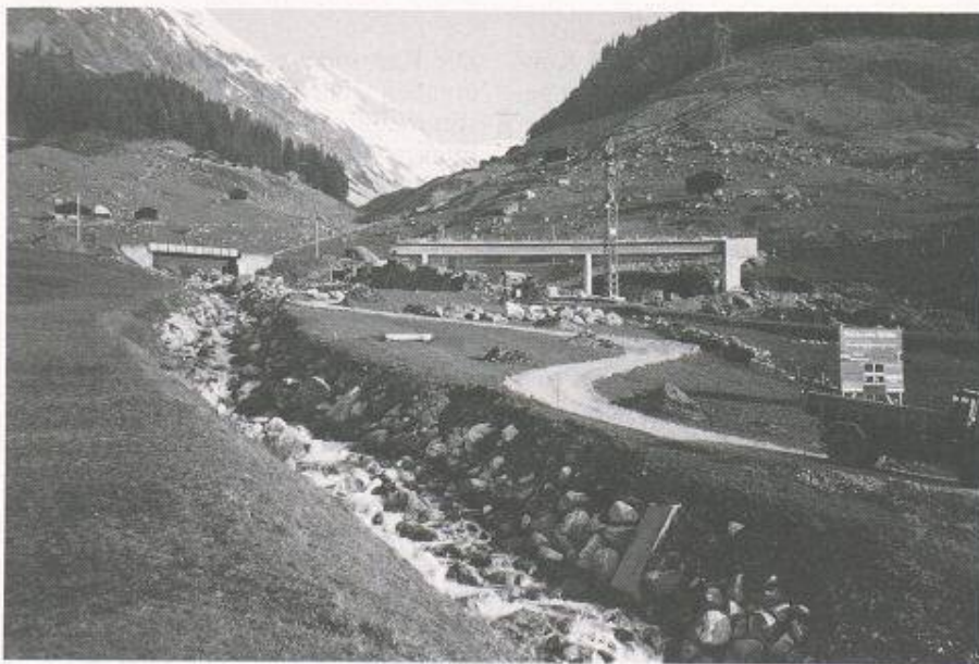
Bild 2. Bauzustand

ger führten zur Ausarbeitung des neuen Projektes.