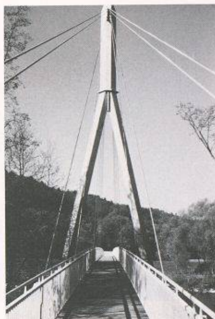
Bild 9. Das fertige Bauwerk von Osten

Schliesslich mussten die ganze Konstruktion gerichtet und die Seile so gespannt werden, dass einerseits die geplante Höhenlage des Steges und andererseits die berechneten Seilkräfte möglichst genau eingehalten werden konnten. Mit schrittweisem Anziehen der Abspann-Muttern an den unteren Seilenden und begleitenden Höhen-Messungen wurde vorerst die geschwungene Nivellette grob eingestellt und anschliessend verfeinert.