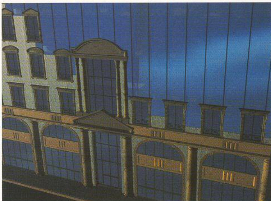
Bild 5. Fassadendarstellung

Am Anfang einer solchen Anwendung wohl kaum. Denn vor der erstmaligen Erstellung einer guten computergenerierten Darstellung von Gebäuden und Einrichtungen sind Software und Hardware zu beschaffen, sind (Vorgehens-) Methoden zu lernen, ist einiges an Er-