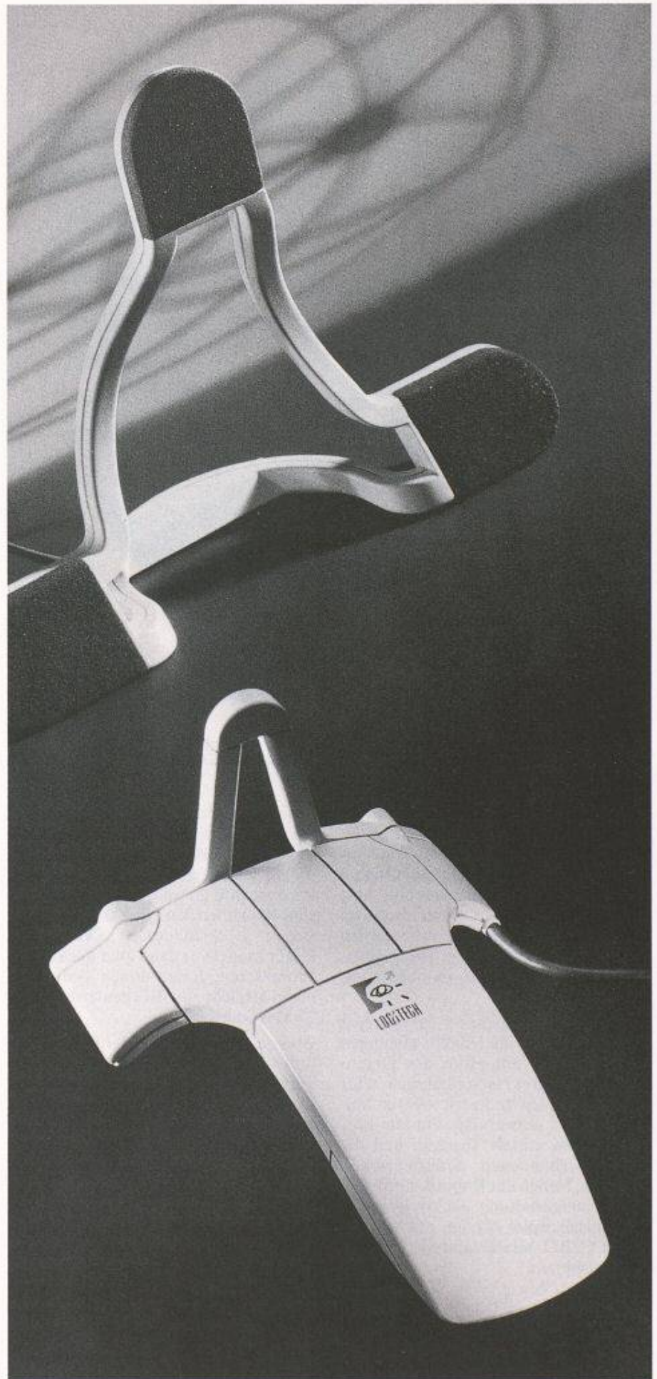
Bild 1. Logitech-3D-Maus

Höhere CPU- und Grafikleistungen ermöglichen es Rechnern heute, die reale Umwelt in einer künstlichen dreidimensionalen Welt - der virtuellen Realität (virtual reality, VR) - abzubilden. VR ist eine 360-Grad-Simulation, die dem menschlichen Sehsinn eine Umwelt vortäuscht, die nur im Rechner vorhanden ist. Leistungsstarke Grafikrechner ermöglichen es dem Benutzer, in das System interaktiv einzugreifen. Die erzeugten Bilder werden ihm innerhalb einer Brille (eyephone) auf zwei Farb-LCD-Displays dargestellt, welche die