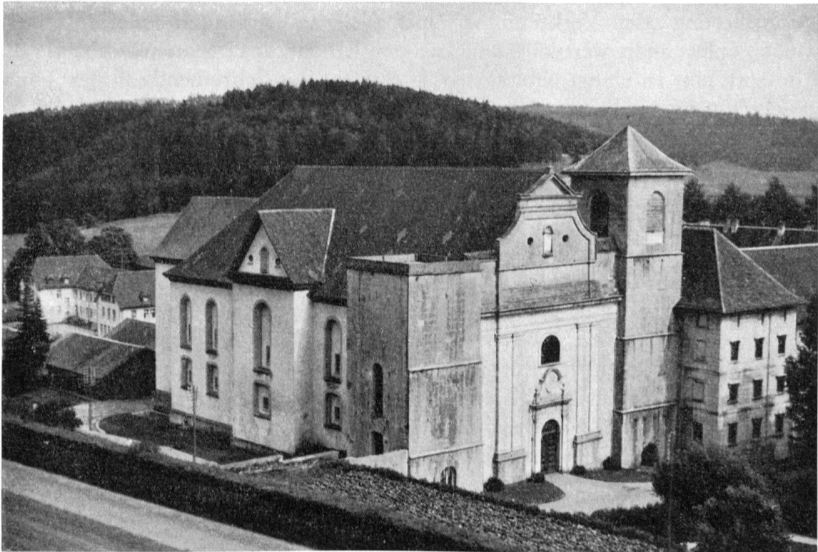
Bellelay. Ehemalige Praemonstratenser-Abtei. Klosterkirche von 1709/14