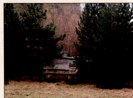
Ein M113 ungetarnt in einer Waldlichtung.

Die multispektrale Tarnung ist vor allem für Länder, die wie die Schweiz nicht a priori auf eine hohe Luftüberlegenheit zählen können und sich trotzdem gegen Aufklärung durch Satelliten, Flugzeuge und Drohnen schützen wollen, von grosser Bedeutung. Tarnung ist ein Schlüssel, um die Überlebensdauer von kostspieligen und komplexen Anlagen und Systemen signifikant zu erhöhen, ein Schlüssel zudem, dessen Kosten im Vergleich zu denjenigen der zu schützenden Objekte nur einen geringen Bruchteil ausmachen.