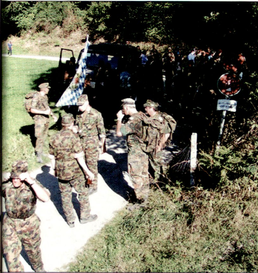
Marschhalt mit Verpflegung u. a. mit deutschen Armeekameraden.

und Deutschland). Der grösste Teil der Marschteilnehmer blickt auch auf eine langjährige Teilnahme am Bündner Zweitagemarsch zurück. Wir dürfen momentan noch jährlich einen Teilnehmer ehren, welcher bisher an jedem Marsch teilgenommen hat. Sehr viele der Aktiven beteiligten sich schon zwischen 20 und 30 Mal an diesem Event. Diese langjährige Bindung ist sicherlich auf verschiedene Faktoren zurückzuführen. Kameradschaft, Lauffreude, die schöne Gegend und auch der Anlass selber sind mögliche Indikatoren, welche die Teilnehmer immer wieder dazu bewegen, am Marsch teilzunehmen.