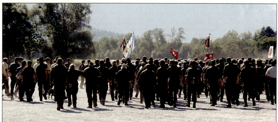
Start zum Marsch.

Die Teilnehmer kommen aus der ganzen Schweiz (inkl. Westschweiz und Tessin) und dem benachbarten Ausland (Österreich