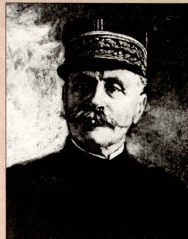
Ferdinand Foch (1851–1929), Maréchal de France, bestand darauf, dass die Kader selbstständig zu denken lernen, eine Forderung, die auch in Ersten Weltkrieg weit gehend Wunsch blieb.

Wie lassen sich also die Notwendigkeit der Vorgabe und der Anspruch der Handlungsfreiheit in Zeiten der Unsicherheit miteinander in Einklang bringen? Die Antwort findet sich in der Auftragstaktik. Dieses «Führungsverfahren, in dem der Unterstellte im Rahmen der Absicht des Vorgesetzten ein Maximum an Handlungsfreiheit zur Erfüllung seines Auftrages erhält» , stellt die Führungsmethode der Schweizer Armee dar, 12 welche es ermöglicht, der Komplexität des