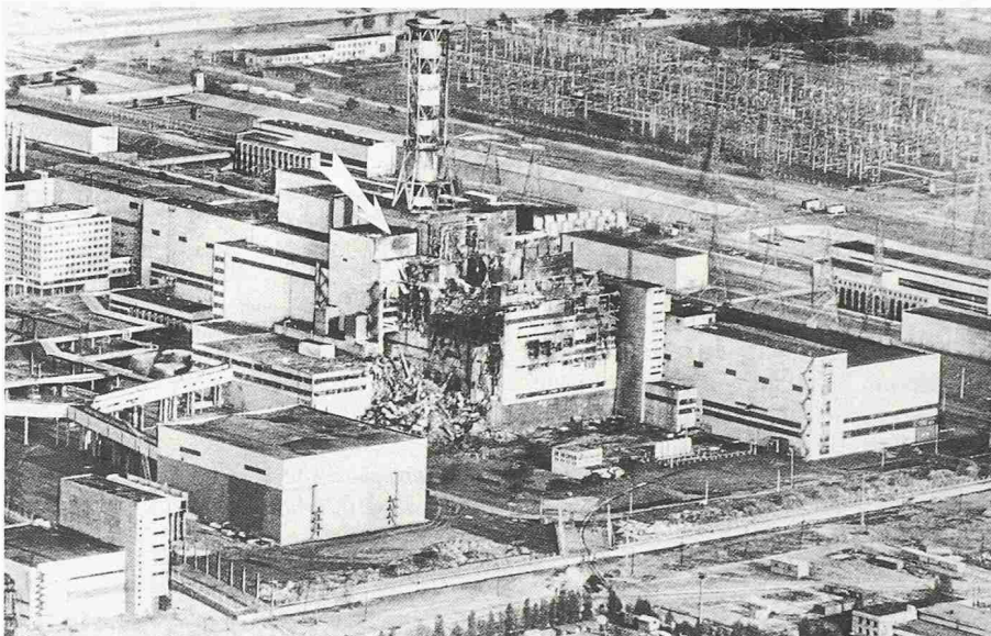
Die Verseuchung durch den Unglücksreaktor von Tschernobyl (in Bildmitte) vertrieb 1986 einige zehntausend Menschen aus ihren Heimen

Fruchtbares Land wurde in den letzten Jahren durch umweltschädliche Bodennutzung zu Brachland oder Wüsten. Rund 135 Mio. Menschen leben in Gebieten, wo sich die Wüste ausbreitet und ihre Zahl steigt. Dies zeigt sich in Afrika besonders hart in der Sahelzone.