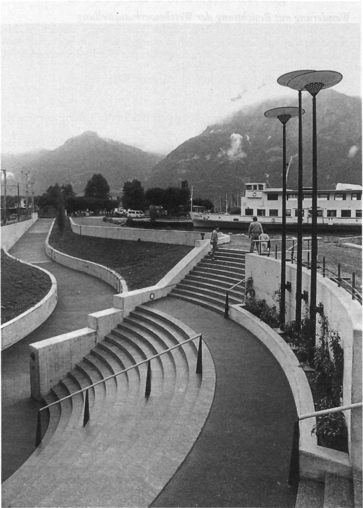
Der ausserrhodische Beitrag am Weg der Schweiz: Seeufergestaltung in Flüelen.