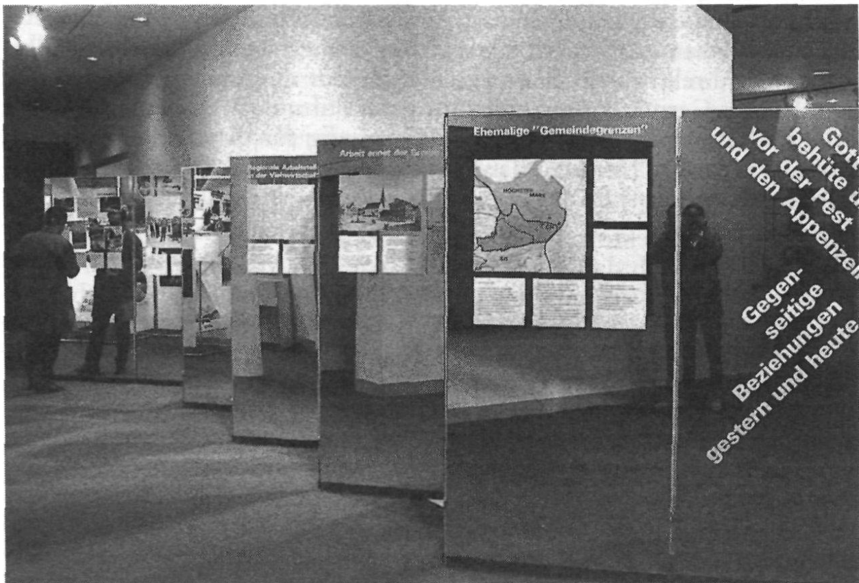
Die Ausstellung «Bekannt/unbekannt: Begegnung Appenzell Ausserrhoden und Vorarlberg» im Volkskunde-Museum in Stein.

Die gesamten Aktivitäten 1991 wurden unter das Rahmenthema «Gesellschaft im Wandel» gestellt. Realisiert wurde ein Konzept mit den folgenden Teilen: eine zentrale Ausstellung im Volkskunde-Museum in Stein, die im November und Dezember in erweiterter Form im Palais Liechtenstein in Feldkirch zu sehen war, und Aktivitäten, die mit der Ausstellung in thematischem Zusammenhang standen.