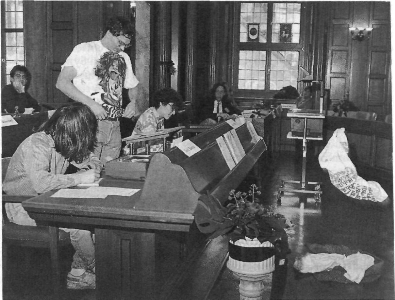
Jugendliche Kantonsparlamentarier und zukünftiger Regierungsrat. (Gantenbein)

Mit soviel inspirierenden Einleitungen musste ein Weiterführen des Jugendparlamentes schon fast nicht mehr angezweifelt werden . . . Nach einigen Debatten kamen wir auf folgende Strukturierung: