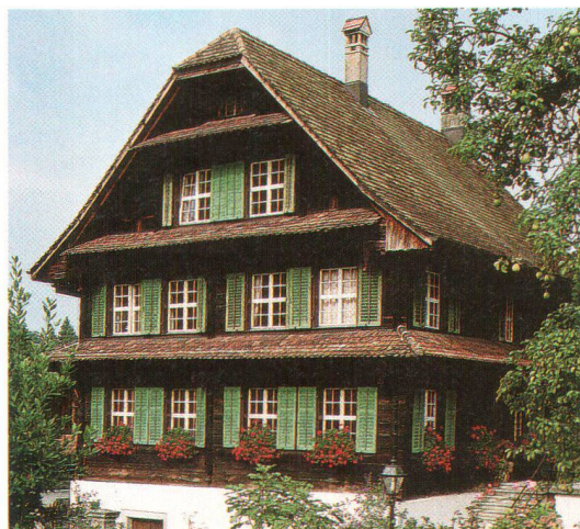
Schlanker, laubenloser Blockbau mit klassizistischer Fassade, erbaut 1705: das Pfarrhaus in Risch

Die weitere Entwicklung des traditionellen Holzbaus betraf nach 1500 vor allem die äussere Form, die Fassadengestaltung (Dekor, Symmetrien, Fensterformen und Farben) sowie das Dach. Im ausgehenden 17. und vor allem im 18. Jahrhundert kam das Zimmerhandwerk zur Blüte, was sich in kunstvoll gestalteten Fassaden und – etwas weniger gut sichtbar – in komplexen Gefügen zeigt. Im Raumkonzept hingegen sind nur geringfügige Änderungen zu beobachten. So befinden sich im Vorderhaus in der Regel eine grössere Stube sowie eine kleinere Nebenstube und dies von ältesten erhaltenen Bauten bis in die 40er-Jahre des 20. Jahr-