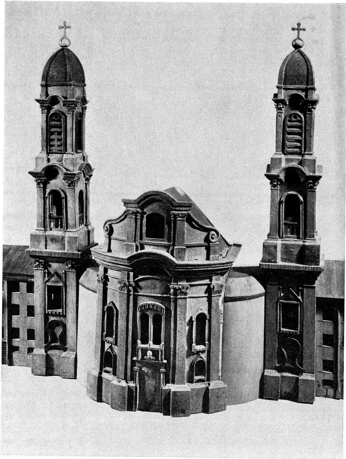
Abb. 4. Modell der Westfassade des Klosters Einsiedeln, Ausschnitt: die Kirche. Augsburg, Städtische Kunstsammlungen