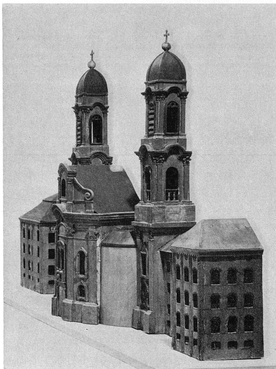
Abb. 2. Das Modell in Schrägansicht von rechts (Südwesten)

fest 4 . Am 31. März 1704 bei Tagesanbruch fand die Grundsteinlegung statt. Die Arbeiten begannen kurz darauf mit dem Bau des Refektoriums und der Küche, im Mittelrisalit des Südtrakts, die 1706 im Rohbau fertiggestellt wurden; 1705–1707 folgte der Ostteil des Südtrakts mit dem südöstlichen Eckrisalit, 1707–1708 der Westteil bis zur Prälatur im südwestlichen Eckrisalit. 1709 setzten die Arbeiten am Osttrakt ein, 1710–1711 wurden der Nordtrakt vom nordöstlichen Eckrisalit bis zum Chor der Beichtkirche, die als Querriegel von der Nahtstelle zwischen Langhaus und Chor der Klosterkirche aus nach Norden stößt, und gleichzeitig auch der symmetrisch zur Beichtkirche nach Süden in Rich-