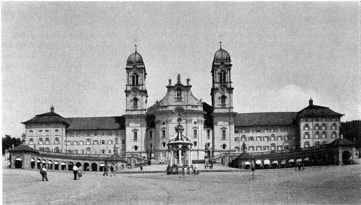
Abb. 5. Einsiedeln. Die Klosterfassade von Westen

richtet P. Sebastian von Reding, der in Vertretung des als Spiritual in Fahr weilenden P. Joseph Dietrich von 1700 bis 1704 im Kloster Tagebuch führte, Bruder Caspar Mosbrugger sei die Anfertigung eines Grundrisses und eines Modells der zu bauenden Klosteranlage befohlen worden 22 . Im Brief Luigi Fernando Marsigli's an Abt Maurus von Roll vom 25. August 1705 wird geraten, nach einer in Aussicht gestellten Ideenskizze im Laufe des Winters ein Modell und hernach einen Plan erstellen zu lassen; in seinem zweiten Schreiben, am 18. September gleichen Jahrs von Luzern aus abgesandt, kommt Marsigli nochmals auf das Modell zurück, das Bruder Caspar nach der bevorstehenden Begegnung und Aussprache mit ihm wintersüber bauen sollte, und das künftigen Diskussionen als Grundlage dienen würde 23 . Es ist nicht ganz ausgeschlossen, daß wenigstens die beiden Flügel des Westtrakts unseres Modells damit im Zusammenhang stehen, während für das Mittelstück, die Kirchenfassade, 1705/06 oder gar 1703 als Entstehungszeit ausgeschlossen werden müssen.