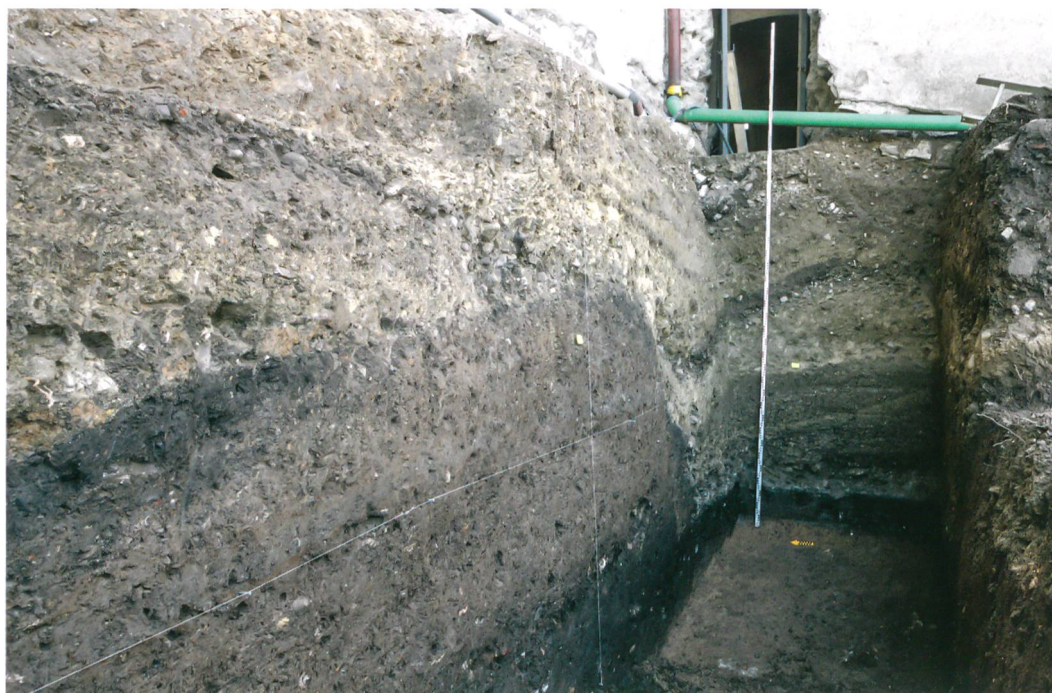
Abb. 3: Thun, Schloss. Südöstlichster Abschnitt der Baugrube auf der Schlossterrasse. In den Profilen zeichnet sich die Stratigraphie der prähistorischen Besiedlung samt Grabenanlage ab. Die helleren Planierschichten und die Grabenverfüllung deuten auf eine erste mittelalterliche Befestigung des Schlossbergs in der Zeit vor 1200 hin. Blick nach Osten.

hohe Mittelalter weist (979–1147 calAD). Alle darüberliegenden Schichten des mächtigen Planierhorizonts der Phase Lila müssen demnach später entstanden sein, wenngleich auch aus diesen Schichten zahlreiche umgelagerte Fundstücke der Bronze- oder frühen Eisenzeit vorliegen. Im Zusammenhang mit dem Bau dieser mittelalterlichen Burg wurde wahrscheinlich der urgeschichtliche Siedlungshorizont grossflächig abgetragen und zur Terrassierung des südlichen Vorgeländes der Burg benutzt. Dies mag erklären, warum im Schlosshof keine Schichten der prähistorischen Besiedlung erhalten geblieben sind und nur wenige ältere umgelagerte Funde von dort bekannt sind. Die beiden muldenförmigen Sohlgräben 433 und 493 (Abb. 1 und 4, Grün) im nordwestlichen Profilabschnitt müssen von der ehemaligen Oberkante des hochmittelalterlichen Planierhorizonts (Phase Lila) angelegt worden sein. Die zugehörigen Nutzungsschichten sind den jüngeren Burg- und Schlossgebäuden zum Opfer gefallen. Die Lage der beiden Sohlgräben 433 und 493 (Abb. 1) auf Höhe des Donjons spricht dafür, dass sie zu einer älteren hochmittelalterlichen Burganlage gehören, die wie der spätbronzezeitliche Graben noch auf die ursprüngliche Topografie Bezug nahm. Nachhaltig geändert wurde die Geländegestalt des Schlossbergs offenbar erst mit dem Bau des Donjons um 1200. Derzeit nicht zu klären ist die Frage, ob die beiden Gräben zu