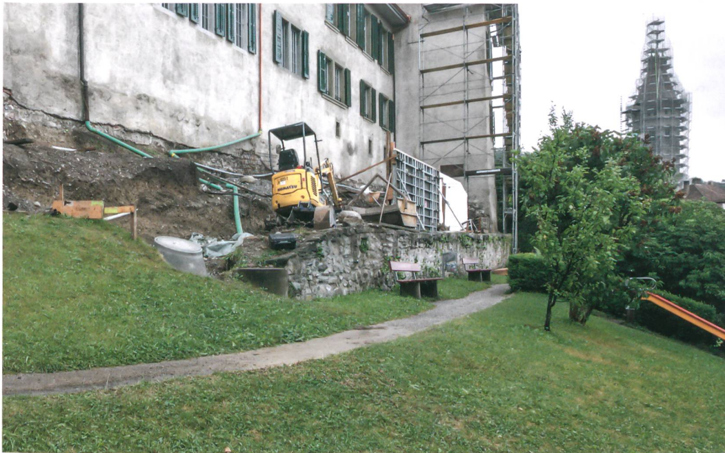
Abb. 2: Thun, Schloss. Baustelle auf der südlichen Schlossterrasse im Sommer 2014. Blick nach Osten.

Seit Langem gilt der Schlossberg als möglicher Kristallisationspunkt der frühen Siedlungsgeschichte im Altstadtgebiet von Thun. Die strategisch günstige Lage hoch über dem Aaretal mit seinen Verkehrswegen und dem Mündungsgebiet des Thunersees bot seit jeher geeignete Voraussetzungen für die Anlage eines zentralen Ortes. Die vom Archäologischen Dienst des Kantons Bern begleiteten Sanierungs- und Umbauarbeiten im Schloss führten in den vergangenen zwei Jahren zu wichtigen neuen Erkenntnissen. Archäologische Funde vom Schlosshof lieferten bereits im Jahr 2013 entscheidende Hinweise zu einer ersten hochmittelalterlichen Burg mit Steinbauten der Zeit vor 1200 (Abb. 1).