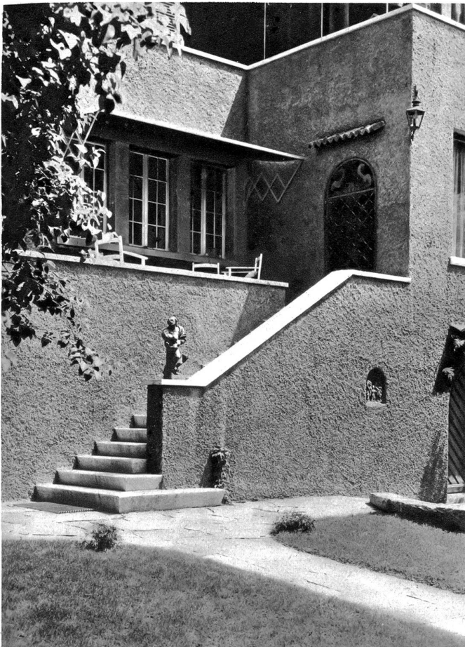
Schmucke Verbindung zwischen Garten und Haus einer Villa in Winterthur