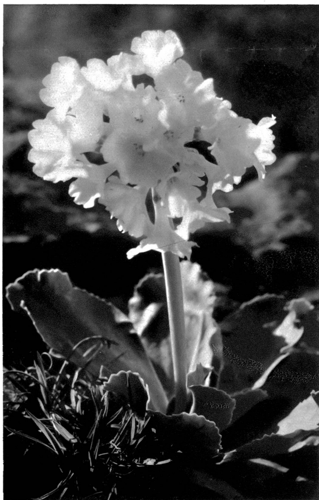
Flühlblume, eine herrliche Primelart