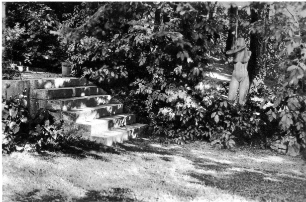
Figur im Grünen