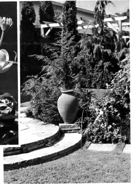
Gartenwinkel bei Bern