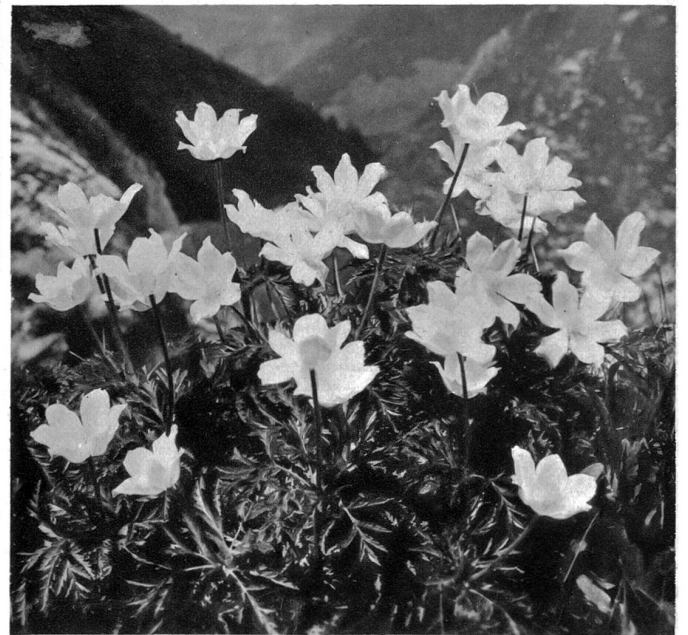
Schöne Zier sind Polster der Anemonen