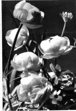
Trollis (Ankenbälli) als Frühjahrgartenschmuck