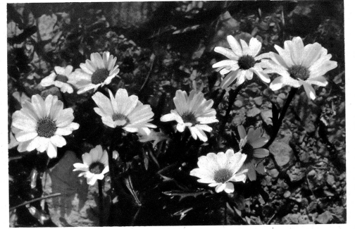
Eine dankbare Gartenpflanze. Margueriten.