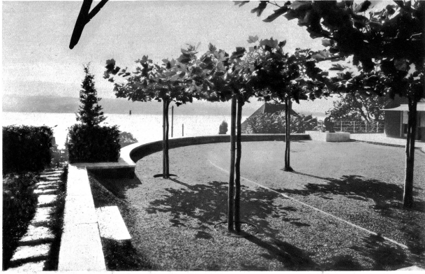
Wohnterrasse am See