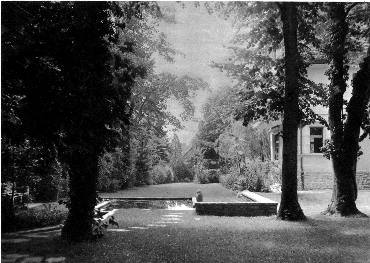
Planschbecken unter Bäumen