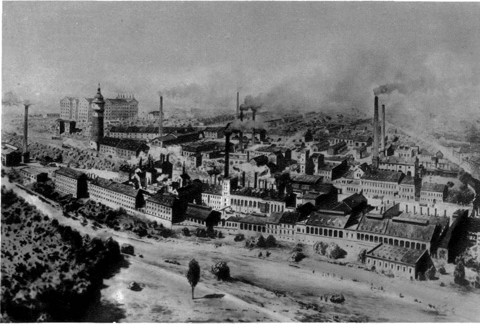
Pilsen. Bürgerliches Bräuhaus. Totalansicht