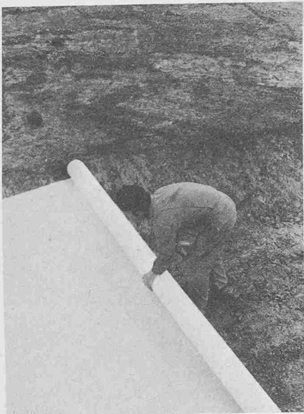
Auslegen eines Geotextils aus verwobenen Polypropylen-Folienbändchen. Man beachte die grosse Breite dieses Bauelementes