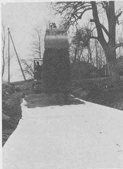
Auf schlechten Baugrund ausgelegtes Geotextil. Der Bagger schüttet direkt eine Belagschicht, auch für Fahrzeuge befahrbar