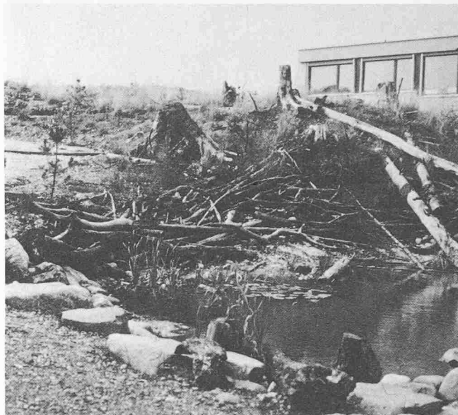
Schulanlage Probstei. Mit Schülern und Lehrern angelegte Landschaft. Anschauung einer sukzessiven Entwicklung von Pflanzen und Tierwelt

Biotope sind bestimmt durch Bodentypus, seine ihm eigene Topographie und das lokale Klima. Die topographische Gestaltung unter Berücksichtigung der Böden und der entsprechenden zukünftigen Biotope ist demnach die bestimmende Massnahme. Leider sind wir weder von der technischen Ausbildung, noch von der emotionalen Einstellung her auf das Thema vorbereitet. Die Elemente des konventionellen Gartens sind Ebene, Böschung und Stützmauer. Was wir nun brauchen, ist eine neue Schule des Raumempfindens, des räumlich-plastischen Denkens und einen neuen Sinn für die naturnahe Modulation des Bodens. Hügel mit Graten und Flanken, Einschnitte und Mulden, Senken und Buckel in reichem Kontrast, raumformend, Perspektiven und Weiten bildend, vor Wind, Sonne und Einblick schützende natürliche