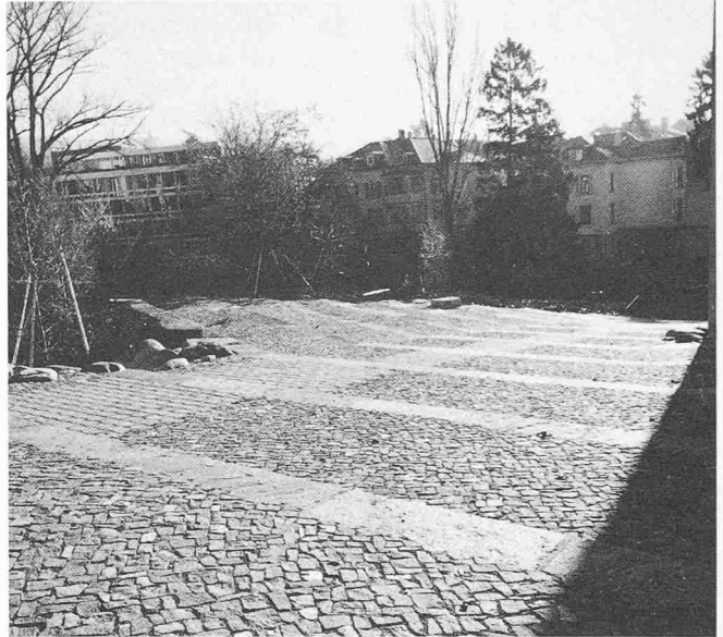
Links: Natürliche verwilderte Gartenpartie mit Kiesweg, Trockenstandort; rechts: Kantonsschule Rämibühl, Landschaftsgestaltung: Harmonisierung der von den Schülern stark genutzten Aufenthaltszonen mit einer natürlichen Topographie und Bepflanzung