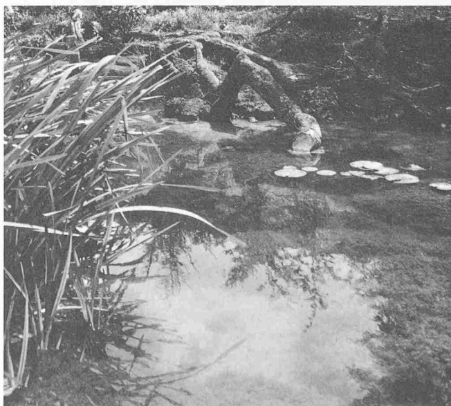
Weiber. Vielfältiges Beispiel der Pionierfolge von Pflanzen und Tieren

Mit diesem gestalterischen Prozess – übrigens in sich wiederum einem brutalen Akt der Zerstörung – greifen wir einem Vorgang vor, der sich in der Natur an dieser Stelle über eine lange Dauer abspielen würde – unsere Imagination rafft den Lauf der Naturgesetze.