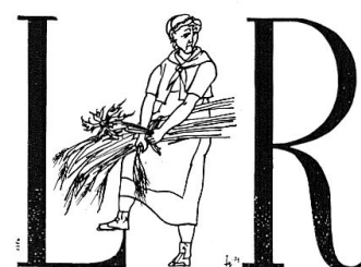
Eine «mamma rumantscha» mit Distel (in: Caricaturas 1981:24).