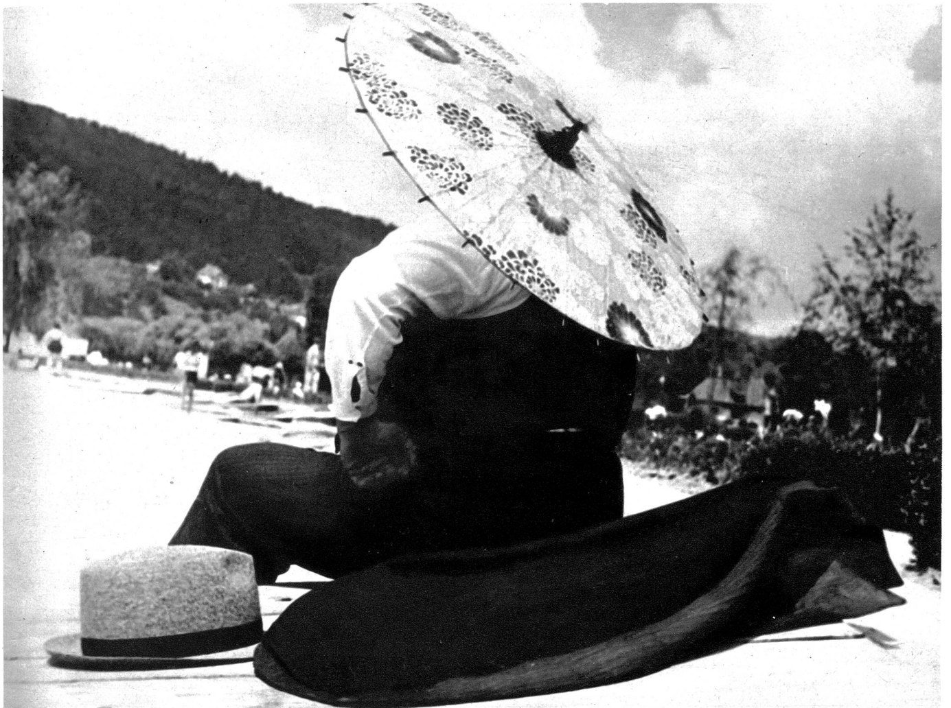
Er zieht vor, unter dem Sonnenschirm seiner Gattin auszuruhen