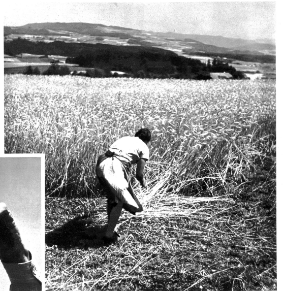
Wiederum rauschen auf dem Lande draussen die reifen Ährenfelder