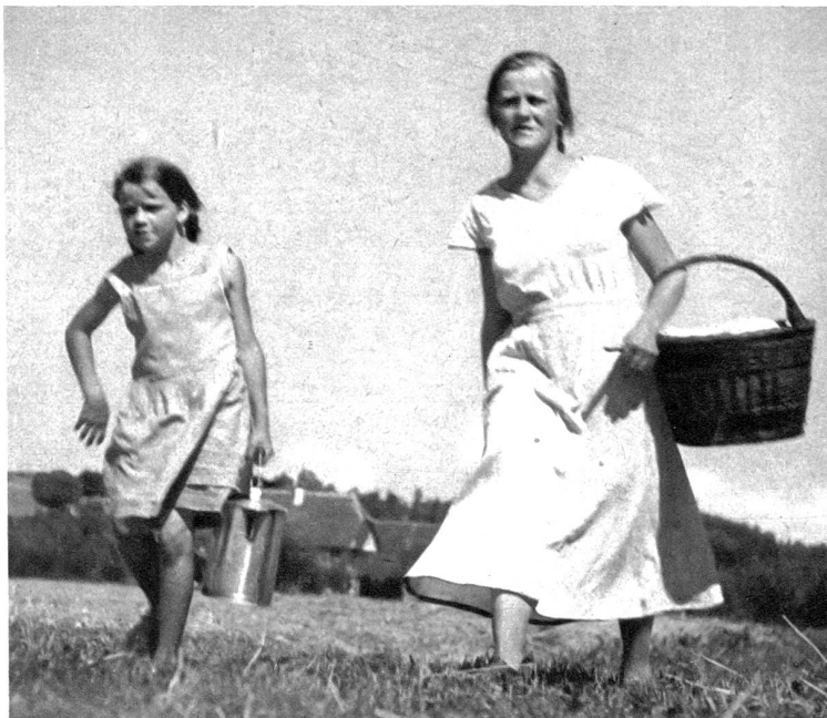
Ständig sind sie unterwegs. Bald hier, bald dorthin bringt die Bauernmagd und das Töchterchen „z'Zimis“ (z'Vieri) auf das Feld hinaus