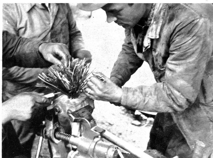
Der Seilkopf ist eingespannt; jeder Draht wird nun umgebogen, um ein Ausgleiten zu vermeiden