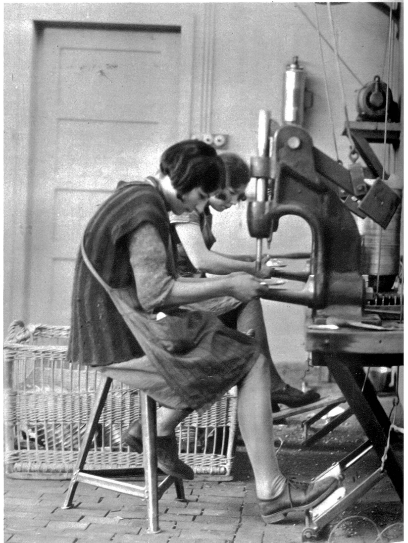
...Löcher für Griffe werden gestanzt

Die Verarbeitung zum Gebrauchsartikel kann auf zwei ganz verschiedene Arten erfolgen, nämlich einmal durch die primitive Art des Drückens, andererseits durch das maschinelle Stanzen und Ziehen. Qualitätsfabrikate werden ausschließlich durch das Zieh- und Stanzverfahren hergestellt, handelt es sich doch darum, hartgewalztes Aluminiumblech durch maschinelle Einrichtungen in die gewollte Form zu stanzen. Es wird nun gerade für die Hausfrau sehr wertvoll sein, den Unterschied zwischen gedrückter und ge-