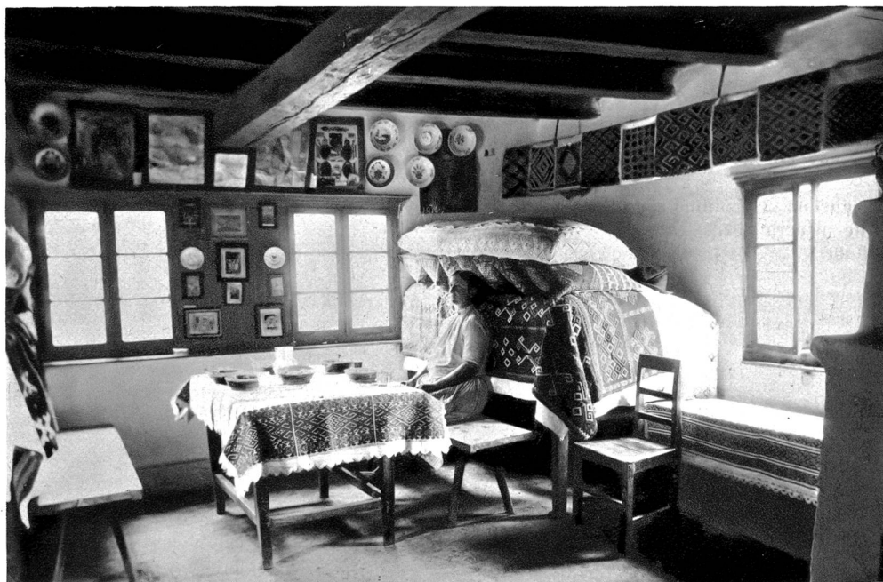
Rumänien. Bauernstube im Banat

Mein spöttischer Ton entging Milica nicht. Mit einer lässigen Geste hatte sie sich ihres triefendes Hutes entledigt. Sie strich die Haare aus dem Gesicht und sah mich stumm an. Aus ihren großen grauen Augen leuchtete mir soviel Zärtlichkeit entgegen, daß ich für ein Augenblick alles vergaß.