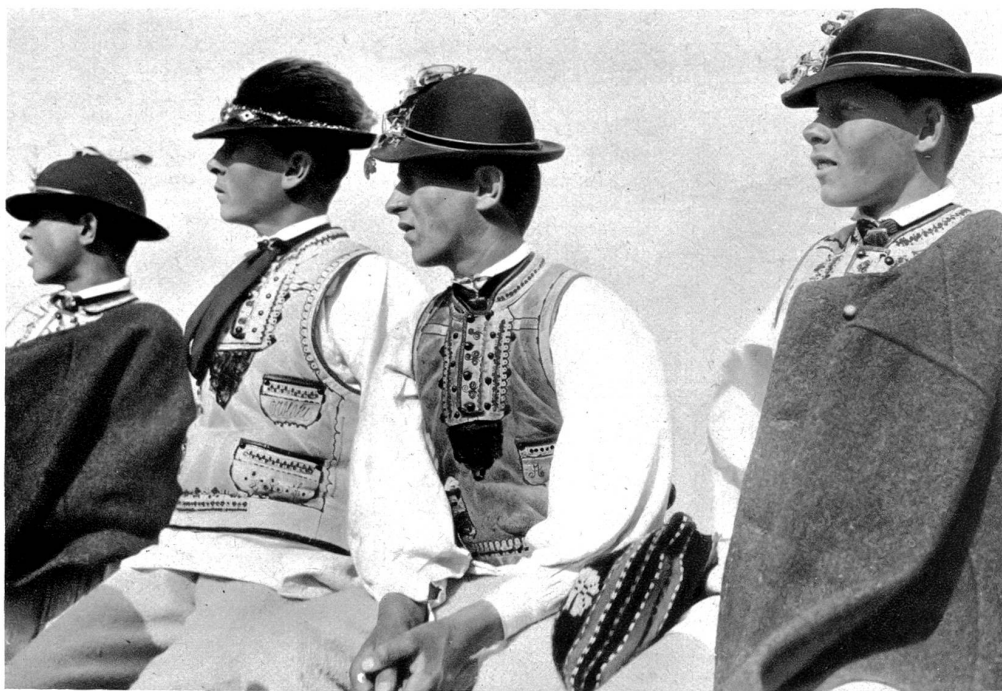
Bauerntypen aus dem Banat (Rumänien)