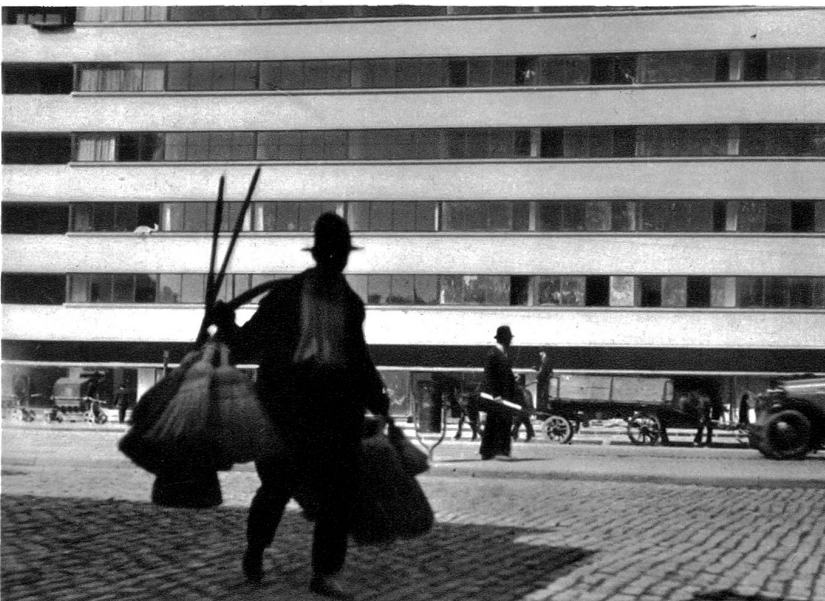
Der Besenhändler im neuen Viertel. Ob er seine Ware nicht bald mit Staubsaugern auswechseln wird?