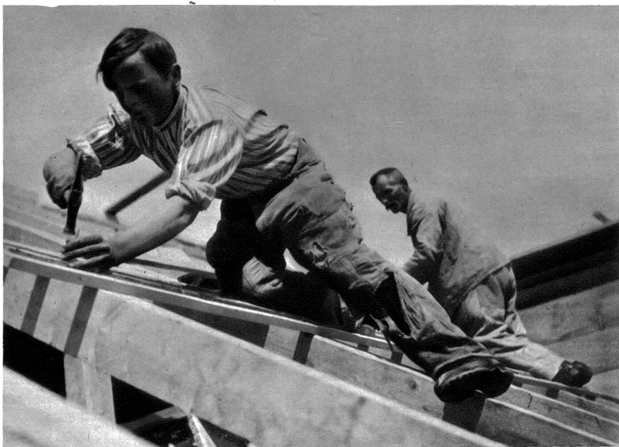
Der Dachdecker bei seiner oft gefahrvollen Berufsausübung

Den einen hält sein Beruf im Bureau fest, der andere schaufelt sich in die Erde hinab, den dritten wiederum führt der Beruf treppauf, treppab, stündlich, täglich, jahrelang. Der Landmann schreitet gemessenen Schrittes hinter seinem Pfluge her, hinter Amboss, Drehbank, SchraubstocK usw. vollbringen Millionen ihr Tagewerk. Und wieder andere üben ihre Arbeit zwischen Himmel und Erde aus. Wer ist nicht schon staunend stehen geblieben und hat dem Zimmermann zugeseht, der hoch oben im Gebälk mit sicherem Schritt die schweren Balken trug. Oder wer hat sich nicht schon schauernd abgewandt, wenn er in schwindelnder Höhe jene Männer sich bewegen sah, die das Eisengebälk der modernen Hochbauten zusammen nieteten. Wer möchte mit diesen Leuten tauschen! Und doch, für sie hat die Tiefe ihre Schrecken verloren, kein Schwindelgefühl macht ihre FüÙe unsicher. Mit der gleichen Sicherheit, mit der wir uns unten auf der