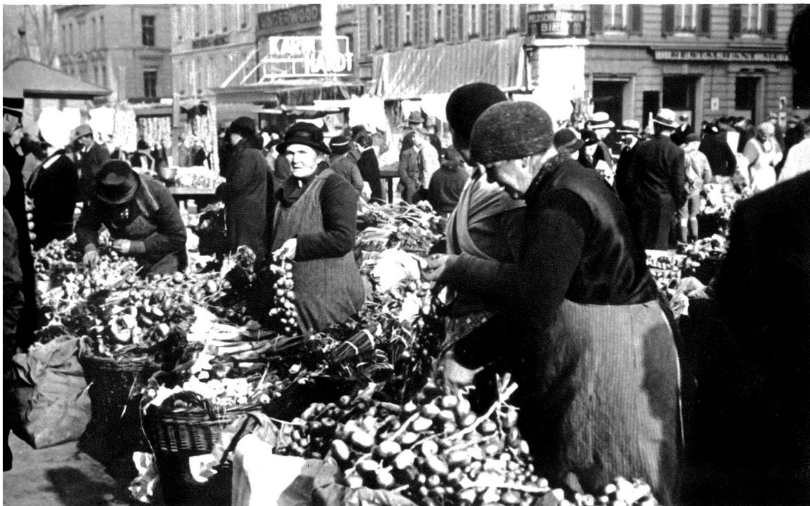
Ziebele, Knoblauch und Lauch, die 3 grossen Artikel, um die es geht

Straßen auf und ab Menschen, die in seliger Erinnerung an Jahre denken, da man durch die „Lauben gondelte“, vor Schaufenstern stehen blieb und den reichen Schmuck betrachtete, bestehend aus Ziebeln und Knoblauch in allen Varianten und dem dazugehörigen „Etwas“. Heute ist's gleich: schon am Samstag wird „aufgefahren“, daß es nur so eine Freude ist, und wer gar am Sonntag sich den Bärenplatz oder die andern Hauptverkaufscentren ansieht, könnte in Versuchung kommen, Bern