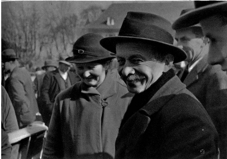
Was dä wieder alles prichtet

Oder versteht ihr nicht deutsch? — wie ich vor vierzehn Tagen am Eiermarkt in Jerusalem war, da haben mich die