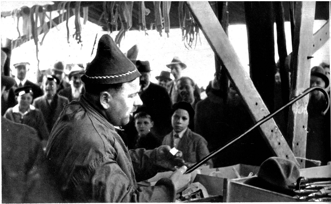
Kauft, kauft, meine Damen und Herren