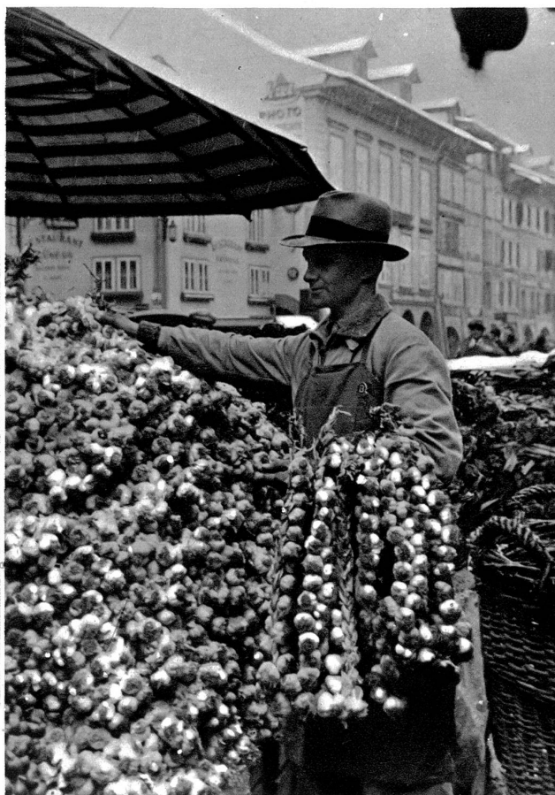
Schöne Knoblauch, dicki Züpfe