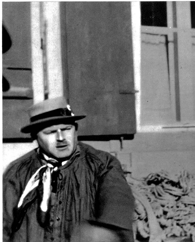
Da si Stricke für ne Bankdiräkter a z'binde

sie und schafft sie: der „Billige Jakob“. Auch er tritt bei diesem feierlichen Anlaß wieder auf, und schon ist er weihnachtlich eingestelt, — Weihnachten, die gewissermaßen in Bern ihre Vorböten vom Ziebelemerit an aufstellt.