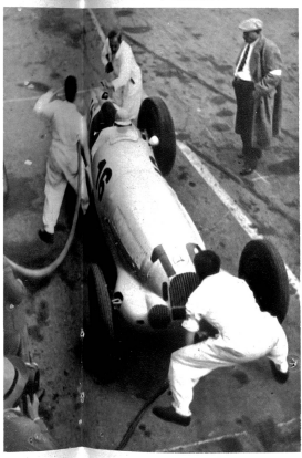
Auf die Sekunde kommt es an. Tanken, Hinterräder wechseln und dem Fahrer den Durst löschen alles insgesamt in 30 Sekunden