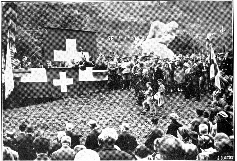
Einweihung des Schlachtdenkmals von Giornico.

Genf beging die Feier mit einem großen Umzug, an dem sich die vaterländischen