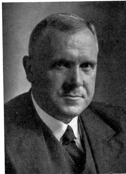
Regierungsratspräsident des Kantons Bern Joss