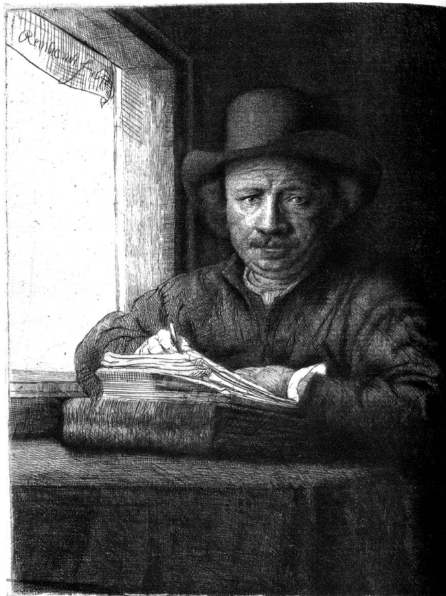
Rembrandt. Selbstbildnis aus dem Jahr 1645

Durch die Macht des Ausdrucks, mit der Rembrandt selbst das scheinbar ganz Undarstellbare anschaulich zu machen wußte, verstand er in ganz einziger Weise die Gleichnisse zu verbildlichen und die Möglichkeit der Darstellung in Stoffen zu finden,