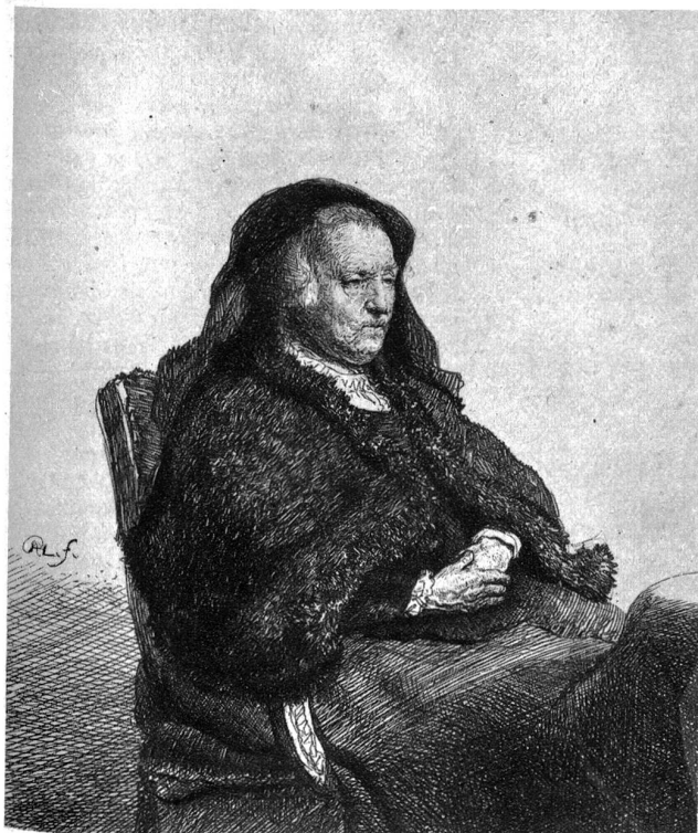
Rembrandt. Bildnis seiner Mutter. Um 1630

wie er Meister war im Festhalten von Szenen oder wie er wieder das Können hatte, solche Geschehnisse aus dem Gedächtnis wiederzugeben.