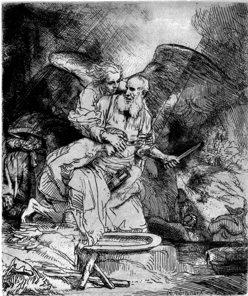
Rembrandt. Isaaks Opferung

wo kein anderer eine solche Möglichkeit erblicken würde. Daneben aber übte sich der Meister auch in der Zeichnung, hauptsächlich in den spätern Jahren. So enthält auch die Ausstellung eine Anzahl Blätter, die als wesentliche Ergänzungen zu den Gemälden anzusprechen sind, und vielfach auch Entwürfe, erste Fassungen, Skizzen zu solchen darstellen. Aber es ist wunderbar, wie deutlich in solchen Skizzen immer dasjenige, worauf es dem Künstler ankam, gesagt ist. Das Wichtigste war Rembrandt immer das innere Leben der Gestalten und aus diesem Grunde spricht uns diese Ausstellung auch ganz enorm zu, da wir hier nicht nur einen Künstler, sondern auch einen Menschen mit einer Seele in seinem Werke genießen und erleben dürfen.