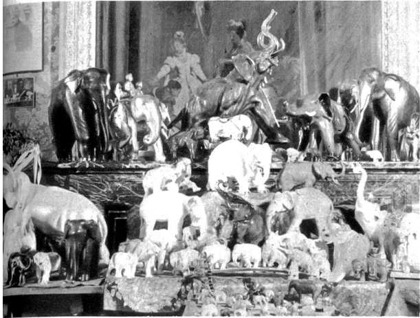
Elefanten aus der Privatsammlung seiner Excellenz