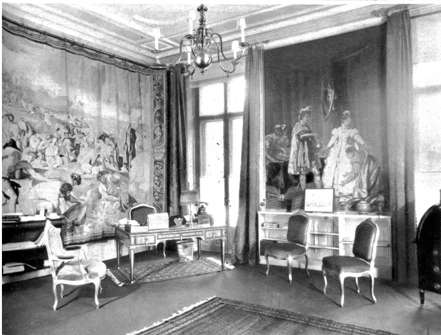
Arbeitszimmer des Botschafters