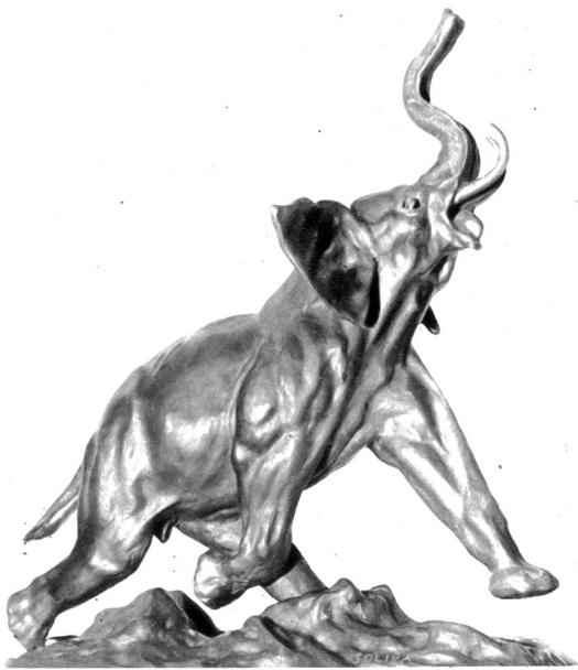
Ein Prachtsexemplar aus der Elefantensammlung